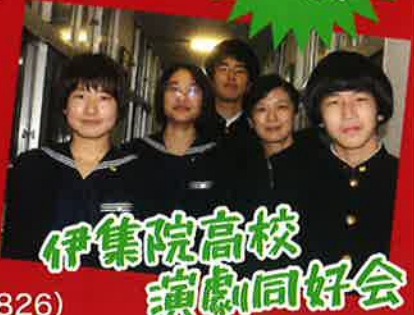
伊集院高校 演劇同好会

チケット 全席自由席 ¥1,000 (税込) ※3歳以上からチケットが必要です。