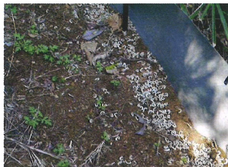
＜アゼシートの外側(山側)への薬剤散布によるヤスデの死骸＞