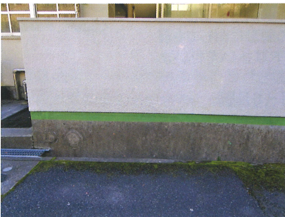
＜養生テープ(緑色部分)を使ったヤスデ返し＞