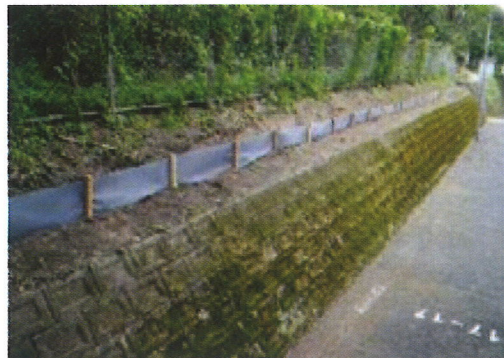
＜アゼシート活用の移動阻止柵＞