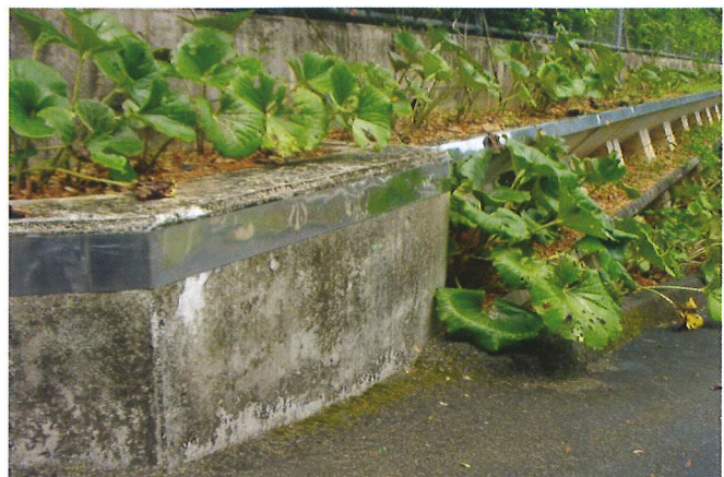
＜ステンレス板を使ったヤスデ返し＞