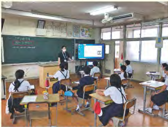
小学校での主権者教育(出前講座)

答 日置市はUPZ圏内であるが、延長の同意を有しない。国の動向を見守り、延長の場合には安全対策を求める。