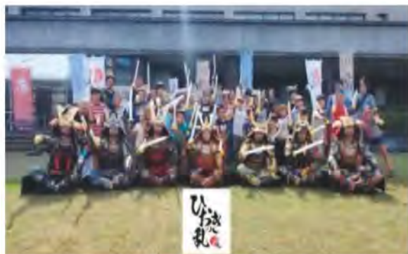
よしとし軍議場にて開催