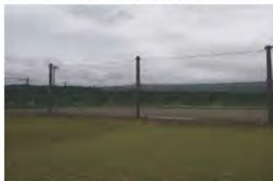
既設5mのネット一部分 を10mへ新設

問 日吉学園テニスコートの防球ネット設置工事について、野球部員が打った際、指導の先生はいたのか。