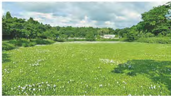
吹上 亀原池の外来種駆除