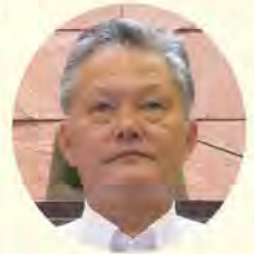
佐多 申至 議員