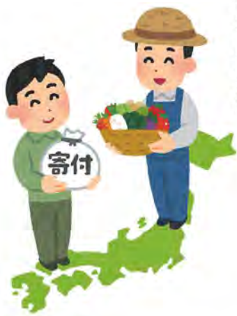
魅力あふれる返礼品や関係人口の増加を

答 若い方からの支援をいただいているが、年齢によって対象となる人を区切るのではなく、幅広く多くの世代の日置市を愛する方々と共に、日置市の未来を創っていききたい。