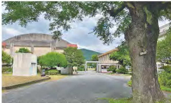
子どもたちの声が消えた小学校跡