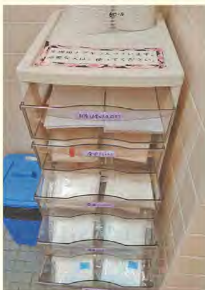
生理用品が設置された奈良県大和郡山市の学校トイレ