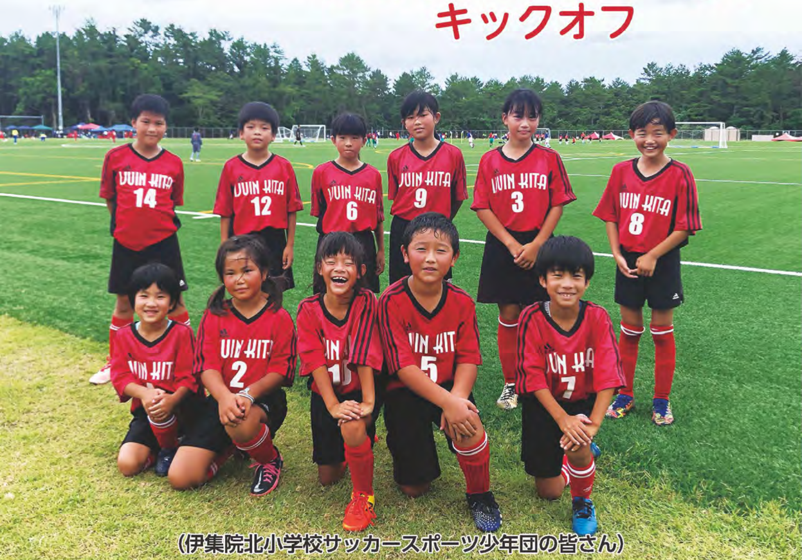
(伊集院北小学校サッカースポーツ少年団の皆さん)