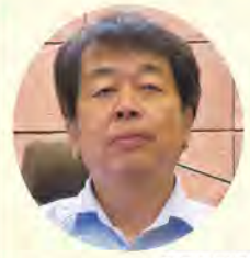
坂口 洋之 議員