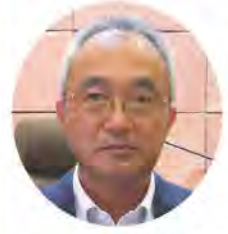
下園 和己 議員