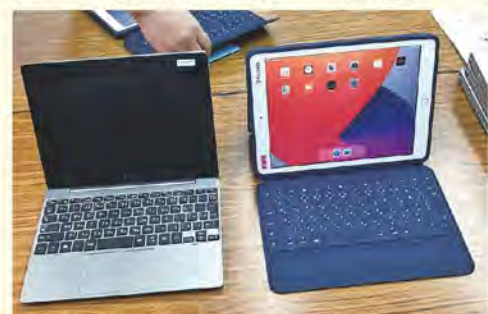
左：中学生用パソコン 右：小学生用タブレット

県下でも先進的な環境を活かし、教職員のスキル差で学習進捗の差が出ないような運用を期待する。今後の研修・指導ス