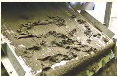
伊集院終末処理場で搬出される下水汚泥

答 分析結果から、肥料としては、さまざまな作物での活用が可能であると考えている。