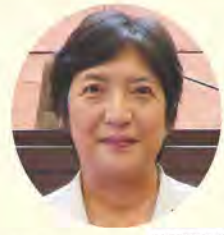
是枝 みゆき 議員