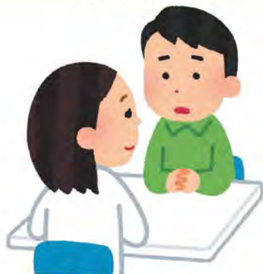
ひきこもり相談窓口等の設置