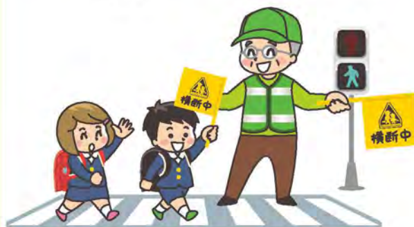
朝日ヶ丘猪鹿倉線 橋梁架けかえ