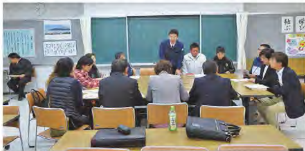
市民と議会の語る会(令和元年度)

まずは日置市内の情報、地域課題を自分事として受け止め、行政と共に草の根が広がる道筋をつくりたい。