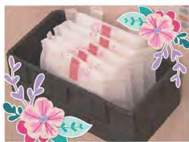
生理用品を市が予算化

一般質問とは、議員全員が年4回の定例議会において、市政全般について問いながら、政策提案を行えるものです。文章は本人の責任のもと掲載しています。