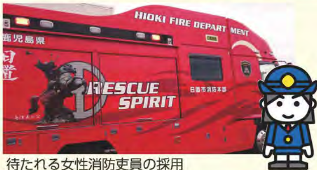
待たれる女性消防吏員の採用