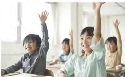
35人学級対応による 学級増 (伊集院小学校)