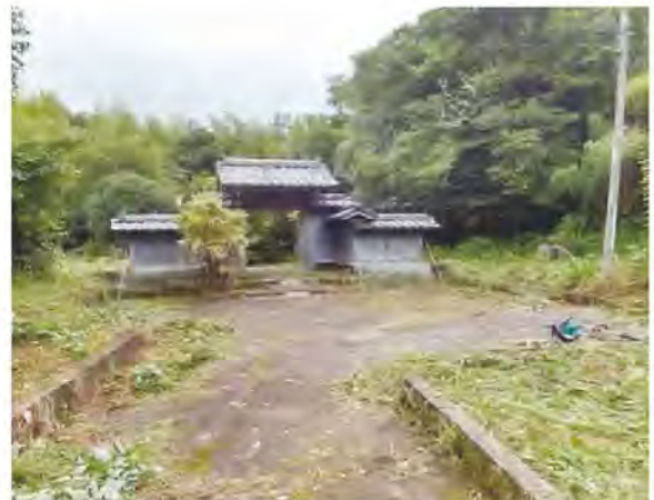
空き家活用での関係人口の創出へ