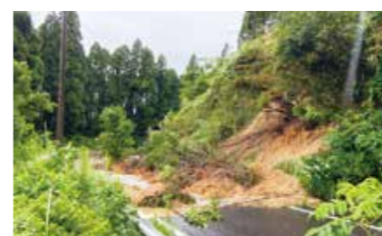
令和3年8月大雨災害復旧 市道笠ヶ野線ほか36件