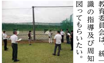
予算審査時の日吉学園防球ネット調査 (既存の5m防球ネット)

◆ 委員の意見 学校側は顧問が校内にいれば不在にあたらず、教育委員会は不在に当たるということで認識がずれている。今回を機に部活動の運営により一層危機管理意識を持つてほしい。