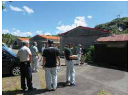
朝日ヶ丘公営住宅を調査

◆ まとめ 今後の整備に際し、補助一般財源を使わないPFI方式や民間の建物を借り上げる方式など公民連携の積極的な研究が必要である。