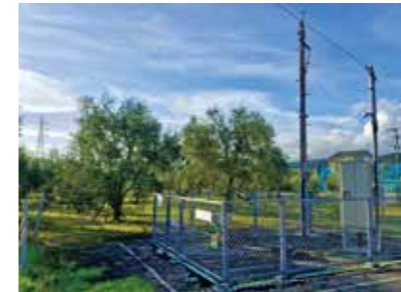
東市来湯田の気象台観測所の雨量計