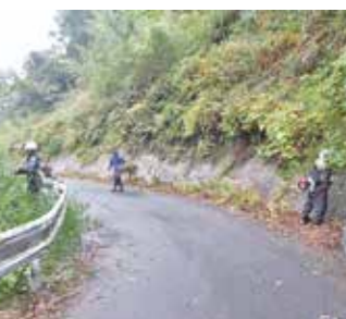
高山校区の市道愛護作業