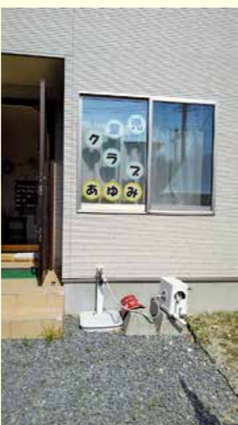
昨年公募し、新設された放課後児童クラブ

答 この計画は、規模や場所、周囲に与える影響など、流動的なものが多いと認識している。