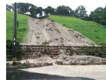
妙円寺小学校の崩落等ほか196件