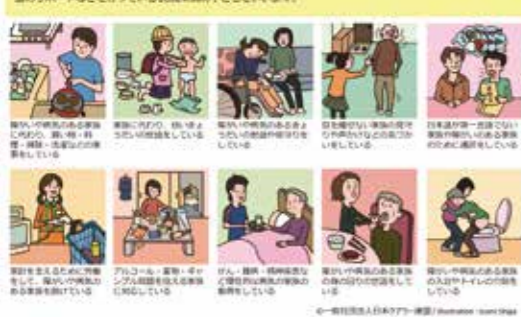
ヤングケアラーはこんな子どもたちです