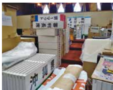
国体等の備品が置かれた東市来支所の議場