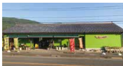
城の下物産館 補修費・備品の購入