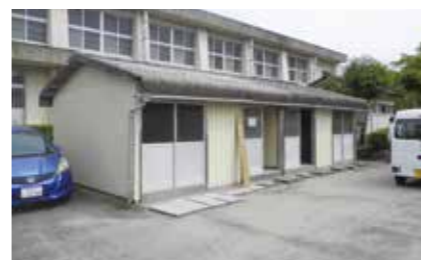
伊集院北中 更衣室棟 解体工事等ほか12件