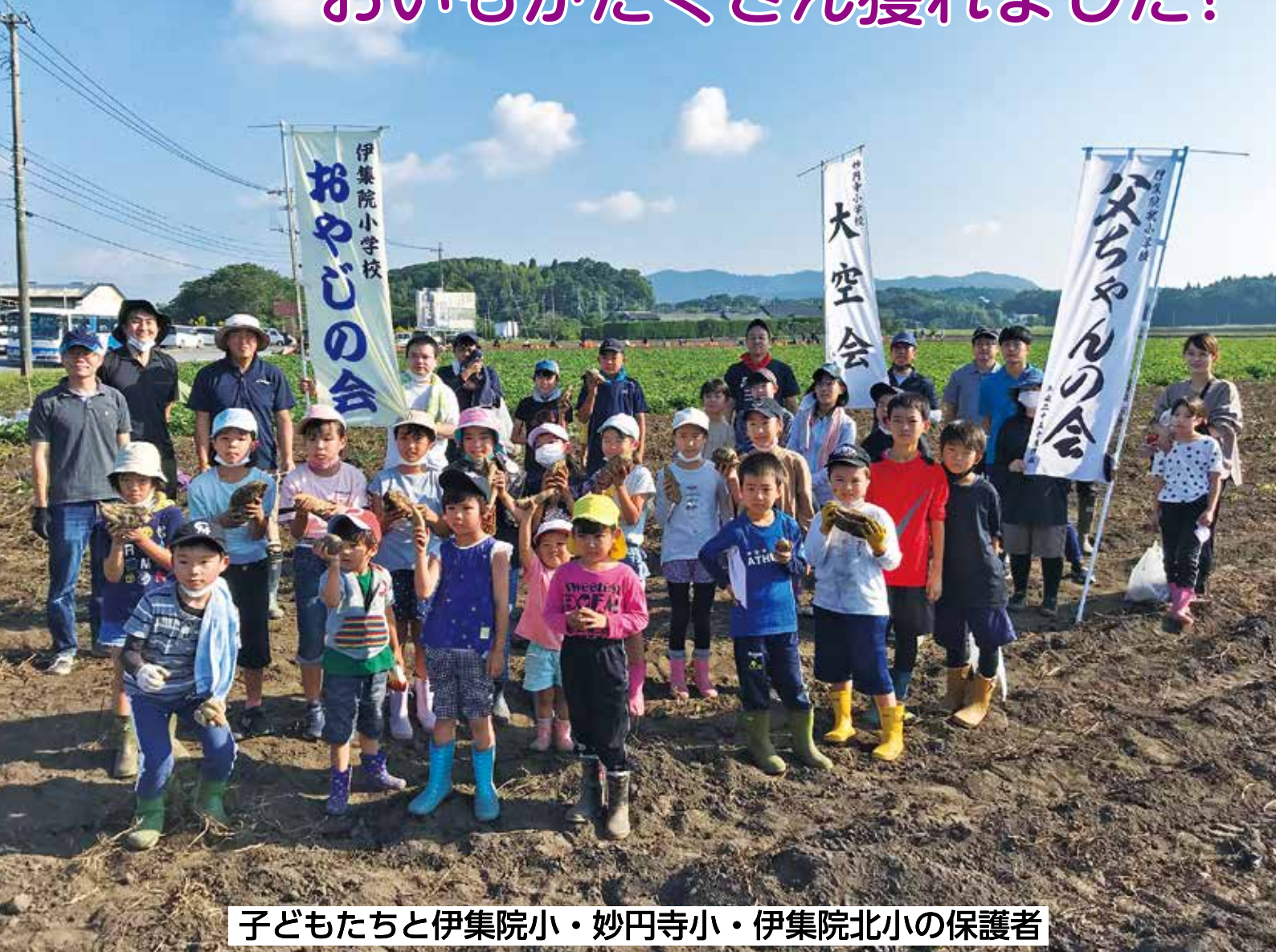
子どもたちと伊集院小・妙円寺小・伊集院北小の保護者