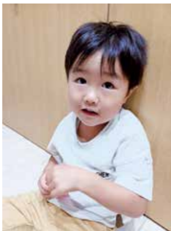
3歳児視力検査での弱視の発見を

答 小学校・義務教育学校前期課程で124教室中40教室、中学校・義務教育学校後期課程で89教室中17教室である。