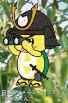
日置市イメージキャラクター 「ひあきくん」