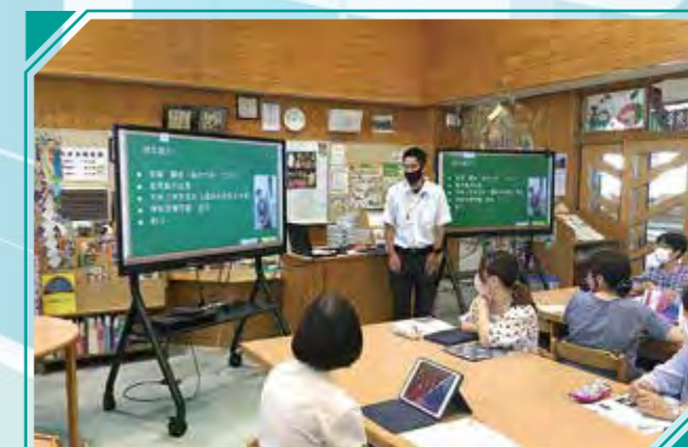
湯田小でのICT研修会

令和3年7月29日に伊集院小、湯田小、伊集院中、3つの会場で小・中学校の先生方合計112人が、活用方法の研修会に参加しました。