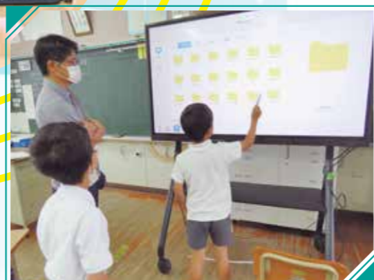
妙円寺小 「電子黒板」活用