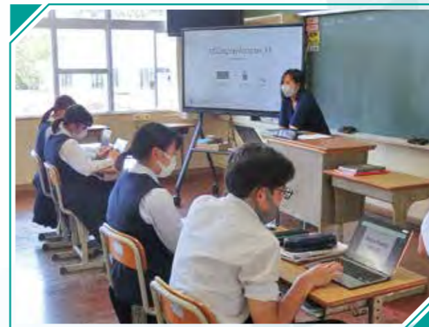
上市来中 「英語科」の授業