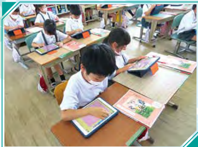
妙円寺小 「道徳科」の授業