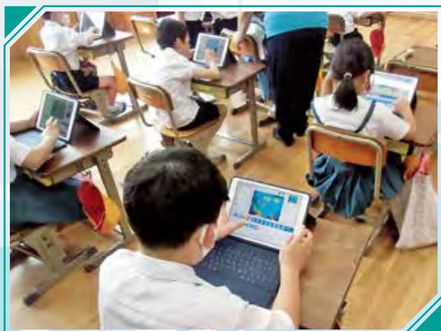
伊集院北小の授業風景