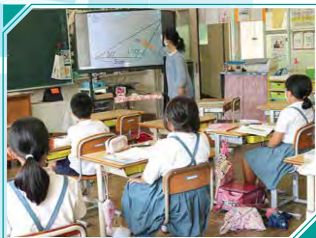
上市来小 「学力向上タイム」