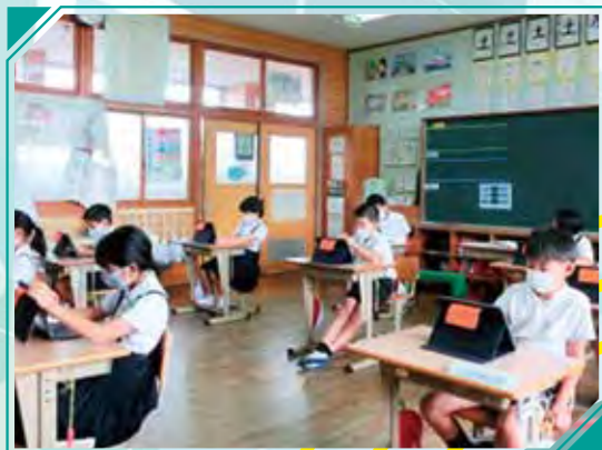
花田小の授業風景