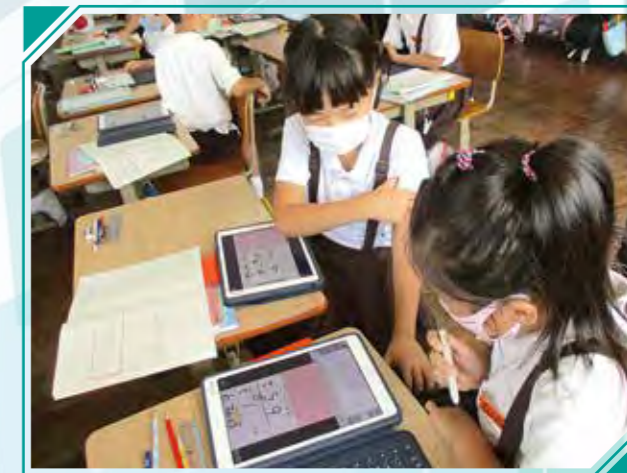
鶴丸小 タブレットを使って学び合い