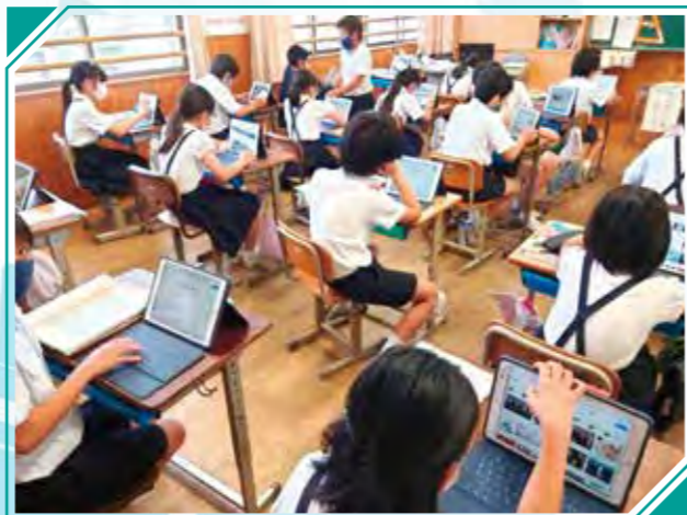
伊集院小の授業風景