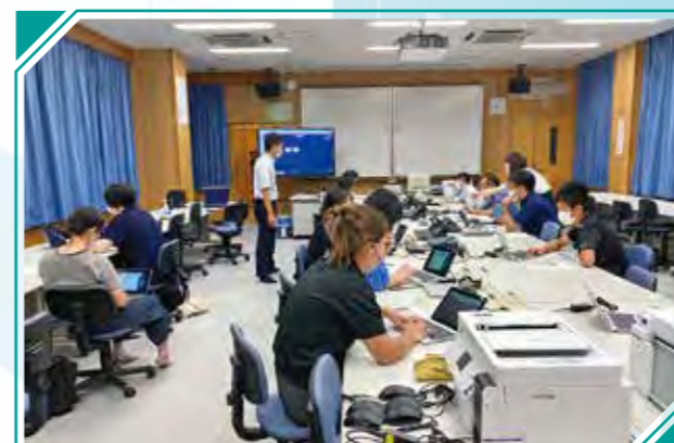
伊集院中でのICT研修会