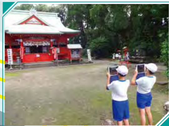
和田小 校外での「タブレット」活用