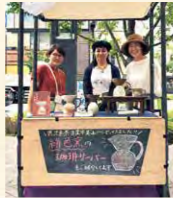
東京・虎ノ門で美山の焼き物を紹介 (コロナ前の2019年9月、協力隊着任2カ月目)

他県から来た私が、移住し、定住したその先で、できることはなんだろう。日置市で出会った人や、自慢できるモノたちを、国内外で紹介していきたい。鹿児島島の焼き物を、北海道で紹介したい。日置市の農作物で頒布会をしたい。直行便のあるアジアで、応援する作家さんたちの個展を企画したい。そして願わくは、いつかそのひとつに、自分の作品もあるといいな。なんて、夢は広がるばかりです。