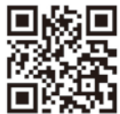
QRコードをご利用の方

「ひおき情報メール」登録用空メールアドレス hioki@ansin-anzen.jp