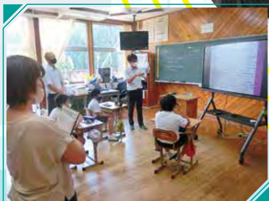
和田小 ICTを活用した「薬物乱用防止教室」