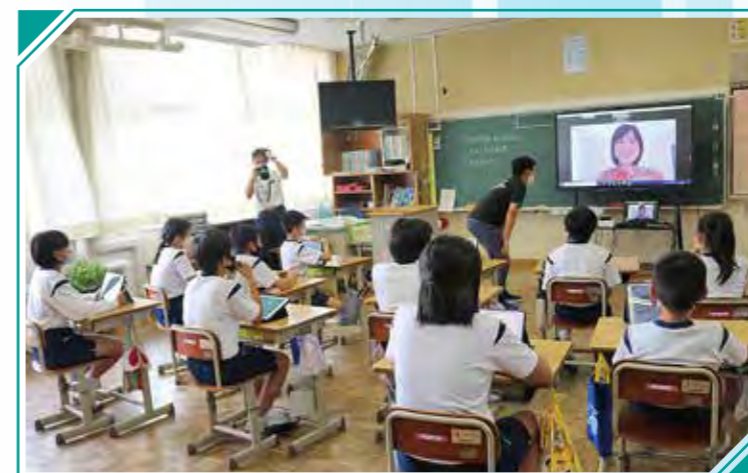
上市来小 ニューデリー日本人学校とweb授業