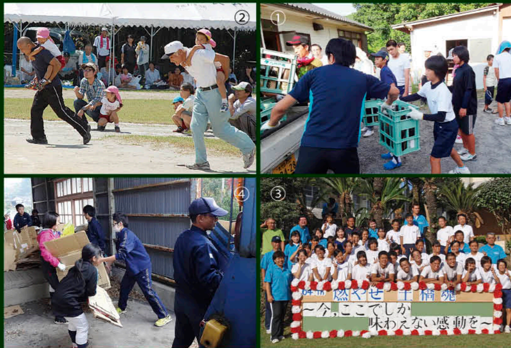
① 保護者と一緒にリサイクル活動 ② 校区と一体の合同運動会 ③ 運動会での笑顔の集合写真 ④ 段ボールリサイクル活動