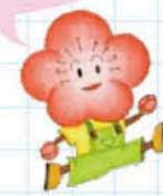
元気な市民づくり運動 イメージキャラクター 梅太郎