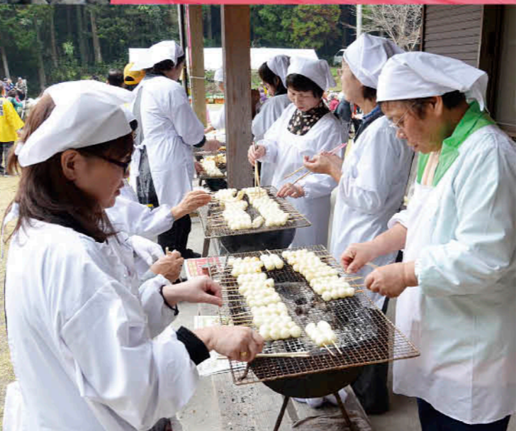
お祭りでは、しんこ団子の販売のほか地域の子どもたちによるステージも