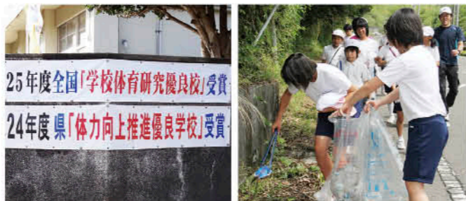
校門には立派な横断幕 小中学生一緒にボランティア清掃

にする習慣がつき、時間に対する価値観ができるきっかけになっています。 他にも、小中一体となった教育も行っています。運動会やボランティア活動などさまざまな活動を土橋小学校と協力。生徒たちには年上としての責任の意識、そして職員間もお互いの授業を研究し合うなど、連携してとても良い関係を築くことができている。 学力向上指定校の取り組みは来年度ですが、引き続き学力向上、体力向上の成果を生かしながら、生徒、職員ともども伸びていくような取り組みを続けていきたいと思っています。