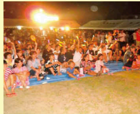
地域住民の親睦を目的とした「夏祭り」