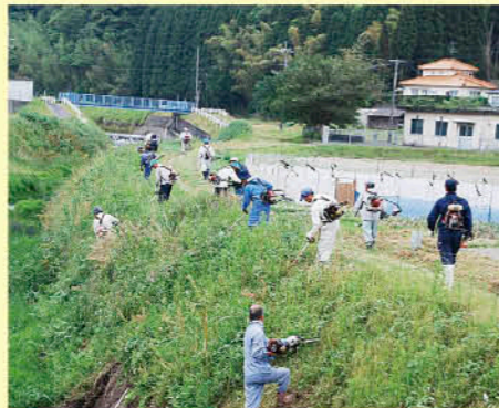
生活環境の整備「奉仕作業」