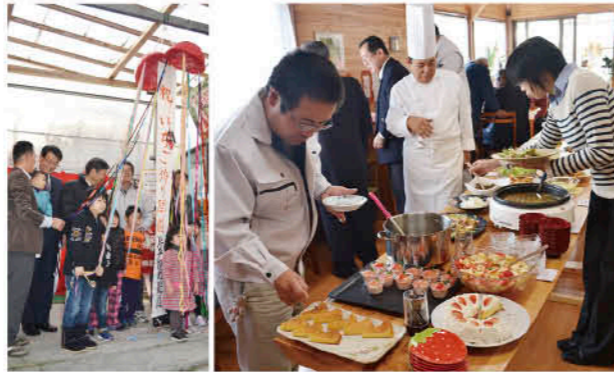
おいしいいちごを堪能