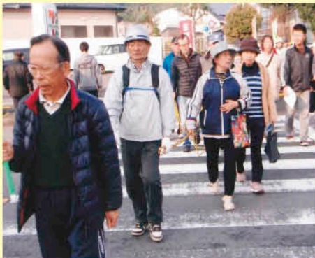
非常時に備える「避難訓練」