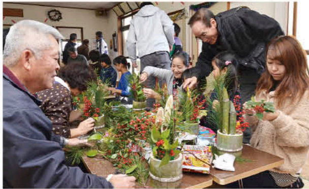
大人も子どもも楽しく門松づくり

新年を迎えるに当たり、12月21日、ミニ門松づくりがつつじヶ丘公民館（伊集院）で行われました。