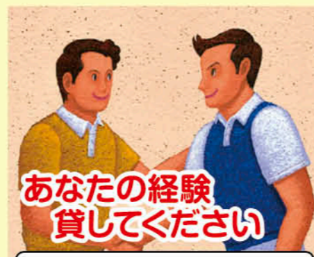
第2期日置市職員まちづくり研究会作成 地域づくり部門キャッチコピー

このような活動を支えるのは地域の住民!! 積極的に自治会活動に参加してください!!