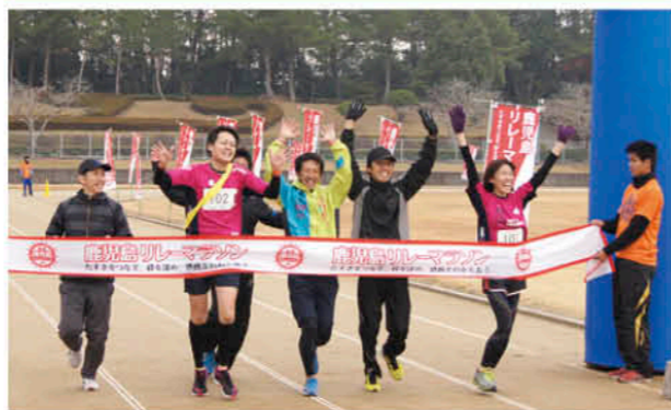
チームと一緒にゴール

第6回鹿児島リレーマラソンが、12月15日、吹上浜公園陸上競技場で行われました。