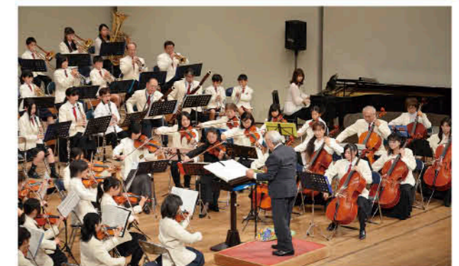
迫力のある華やかな演奏

日置市ジュニアオーケストラ定期演奏会が、12月15日、伊集院文化会館で行われました。