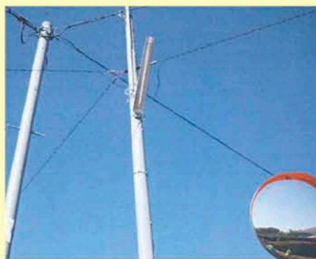
自治会で維持・管理している「防犯灯」