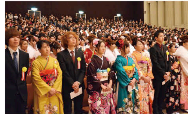
一堂に集まった新成人の皆さん