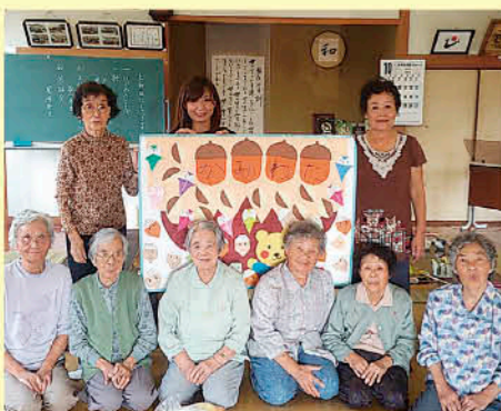
高齢者の生きがいづくり「いきいきサロン」