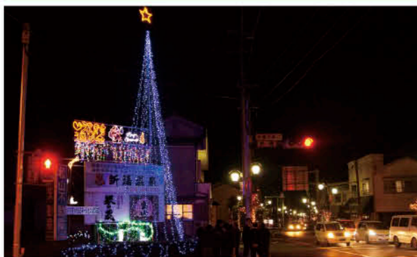
地元を彩るきれいなイルミネーション

伊作えびす通りイルミネーション点灯式が、12月4日、中原交差点（吹上地域）で行われました。