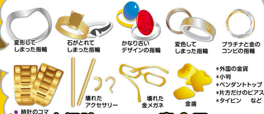
変形して しまった指輪