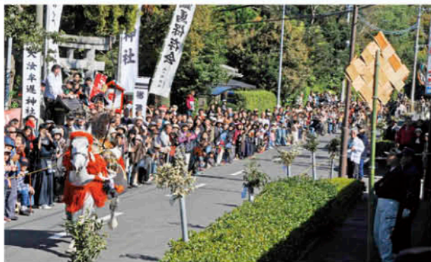
大勢の観客が見守る