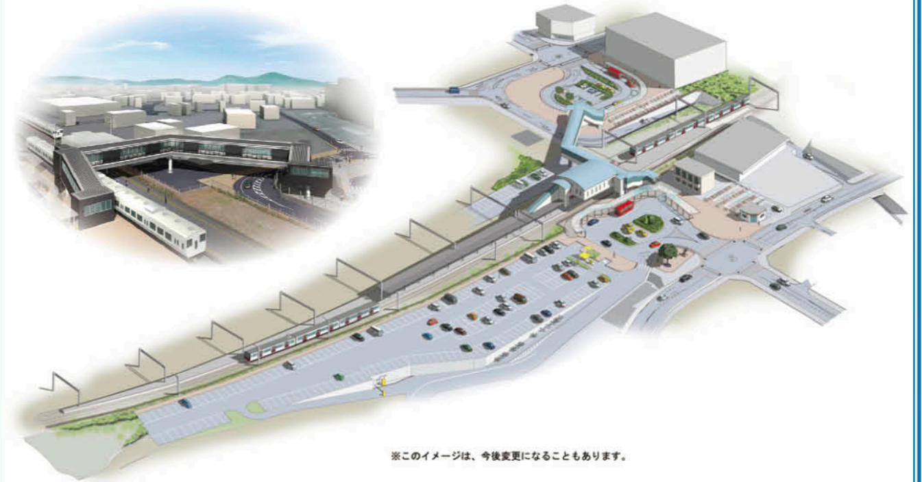
※このイメージは、今後変更になることもあります。