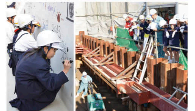
橋台の基礎に記念の文字入れも