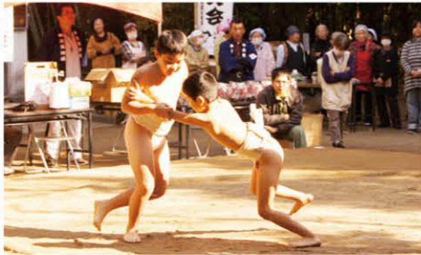
子どもたちの熱い戦い