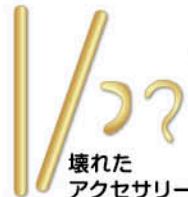
壊れた アクセサリ