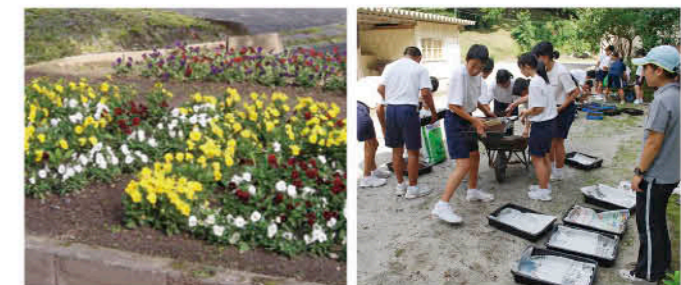
毎年花壇にはきれいな花が

芽が出てからずっと生徒たちは当番を決め、水まきを行い、植え終わってからも除草作業などを行い、丁寧に育てていきます。今回もきれいな花が咲くでしょう。 また、上市来中学校では総合的な学習の中で、学年にあわせて段階的な学習を行っています。1年生は命ふれあい学習や博覧会病院訪問、2年生は職場体験学習、3年生は周辺地域の清掃ボランティア活動などを行っています。 教科を学習するだけではなく、さまざまな体験を通して生徒たちが成長する学校をこれからも目指していきます。