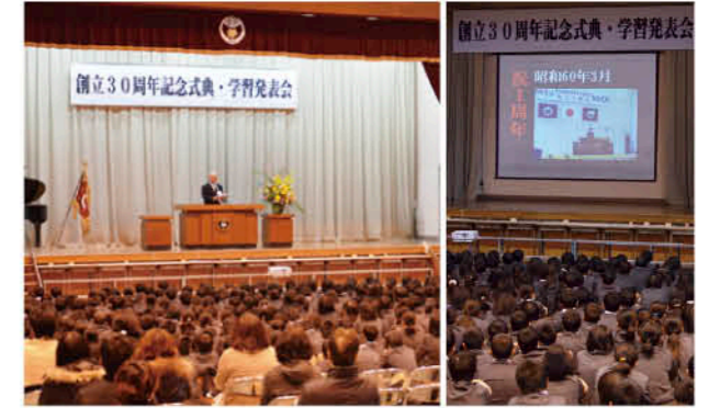
盛大に30周年をお祝い