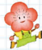
元気な市民づくり運動 イメージキャラクター 梅太郎

「生涯現役で豊かな人生を過ごすために」 ～心も体も健康に!地域に生かそうあなたの魅力!～