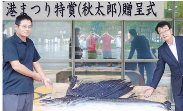
新鮮な秋太郎を贈呈

5月3日に開催された「第21回ふるさと港まつり」の抽選会特賞賞品の贈呈式が、10月5日、江口蓬莱館で行われました。江口漁港で水揚げされたばかりの体長約1.7メートル、重さ約25キログラムの新鮮な秋太郎(パショウカジキ)が当選された3人の方へ贈呈されました。