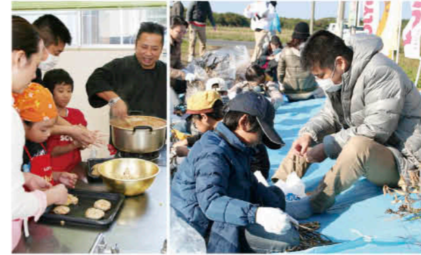
収穫・脱穀から調理まで