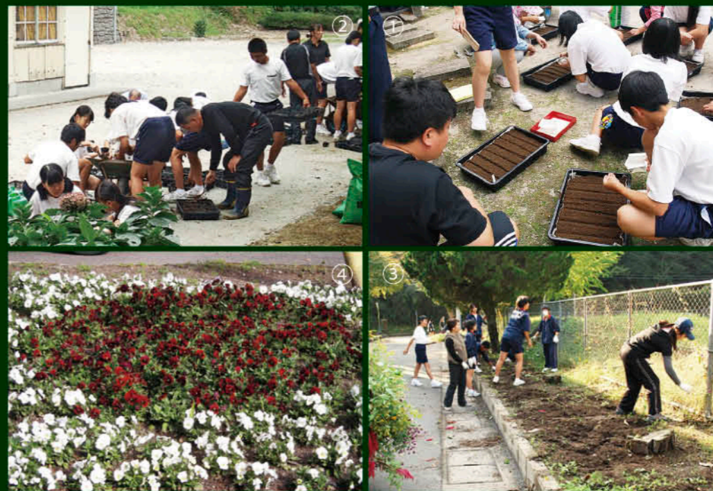
① 9月上旬の種蒔き ② 芽が出たものをビニールポットへ ③ 花壇の土作り ④ きれいに咲いた花たち