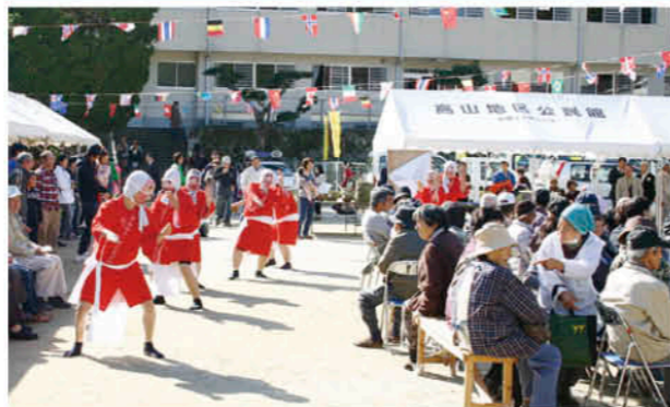
ひょっとこ踊りも披露