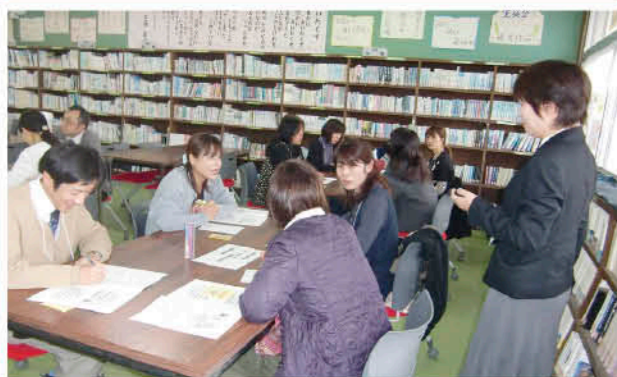
楽しくグループワーク

お互いを大切にしながら良好な対人関係を築くために日置市行政出前講座が、11月20日、吹上中学校家庭教育学級で行われました。