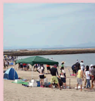
江口浜海浜公園(夏の様子)