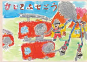
湯田小2年 黒木 湧稀