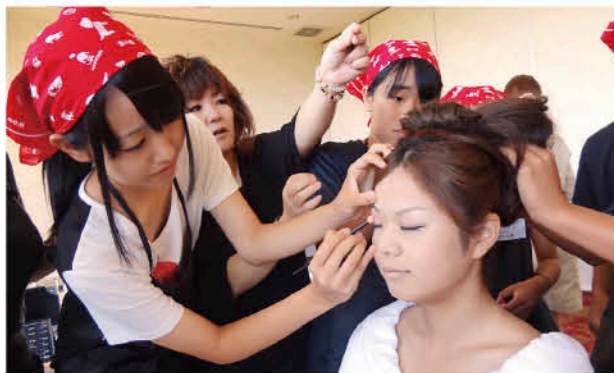
メイクやヘアセットなども体験