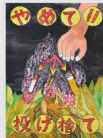
伊作小5年 海老ケ迫 愛