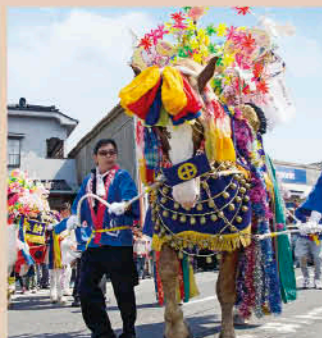
湯之元馬頭観音馬踊り