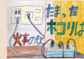
伊集院小6年 橋口 永典