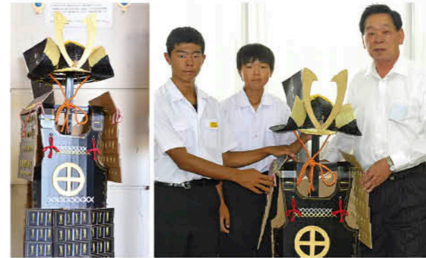
市役所ロビーに飾られている寄附された紙よろい