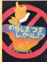
伊集院中1年 新久保 陣