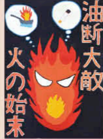
伊集院北中2年 吉村 陵弥