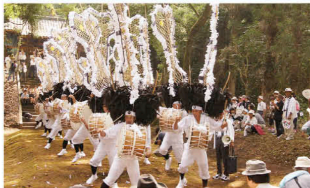
勢いのある勇壮な踊りを披露

無形民俗文化財の伊作太鼓踊りが、8月28日、南方神社(吹上地域)に奉納されました。