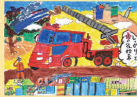
妙円寺小3年 中渡瀬 瑠宇