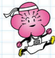
元気な市民づくり運動 イメージキャラクター 梅太郎(運動ver.)

運動普及推進員は、運動に関する情報提供や知識の普及、運動の実践を通して、市民の健康づくりのお手伝いをしています。