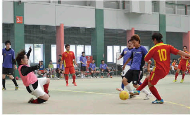
繰り広げられた熱戦

チェスト小鶴ドーム杯フットサル大会が、9月8日に同ドームで開催され、今年は男性の部に9チーム、ミックスの部に12チームが参加し、優勝を争いました。