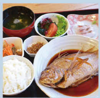
江口蓬菜館 煮付定食 980円 (刺身・サラダ付き)