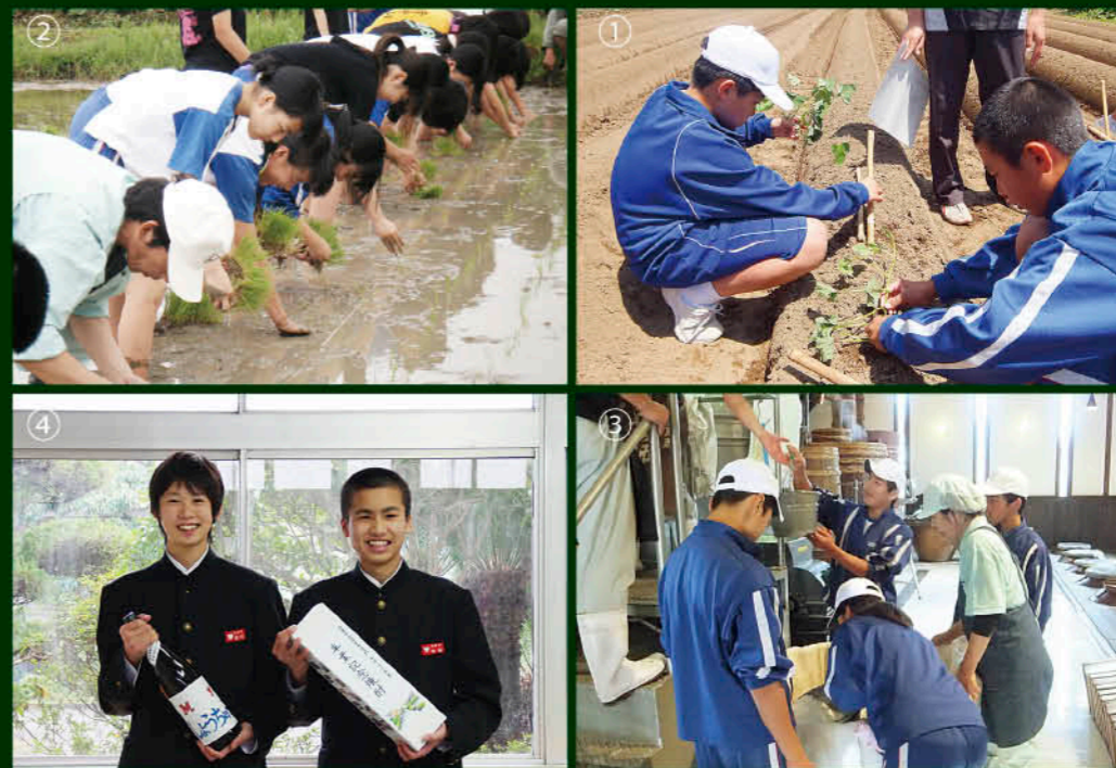
①一つ一つ芋苗植え ②食育農園で田植え ③焼酎の仕込み ④出来上がった焼酎

今年の標語は『本と旅する 本を旅する』です。秋も深まってきます。読書の秋を、そして本との旅を大いに楽しんでください。