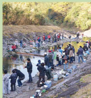
秋祭りの溪流マス釣り大会