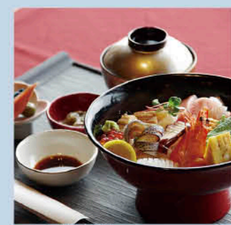
えぐち家海鮮丼 1800円 (デザート・ドリンク付き)