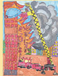
湯田小4年 野上 楓矢