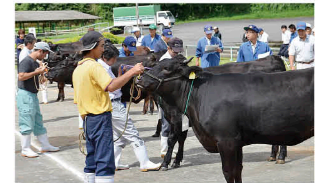
厳正な審査のもと最優秀賞を決定

市 秋季畜産共進会が、9月4日、鹿児島中央家畜市場で行われ、市内の畜産農家が育成した優秀な繁殖用雌牛40頭が出品されました。