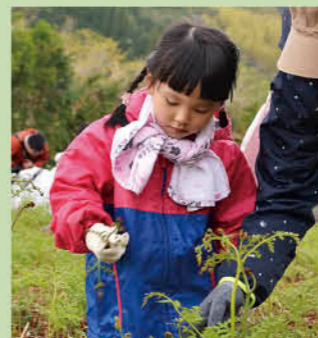
尾木場めだかの里散策&山菜狩り