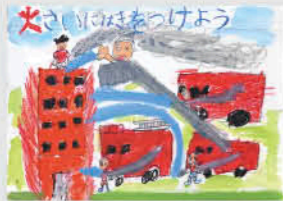
湯田小2年 山口 誠太