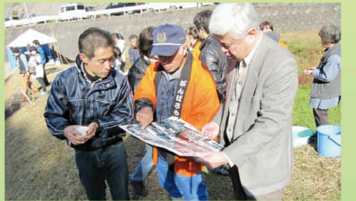
20年を超える釣り大会の取り組みに聞き入ります(郷戸)

農村の暮らしを肌で感じました。メイン会場では、新名物の石窯ピザや柵田米のポン菓子、豚汁に舌鼓。高山を味覚でも体感しました。地区民が総力をあげて高