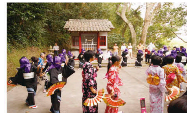
伊勢神社に踊りを奉納

10月27日、花熟里地域(吹上)の伊勢神社で、永吉ほうそう踊りが奉納されました。