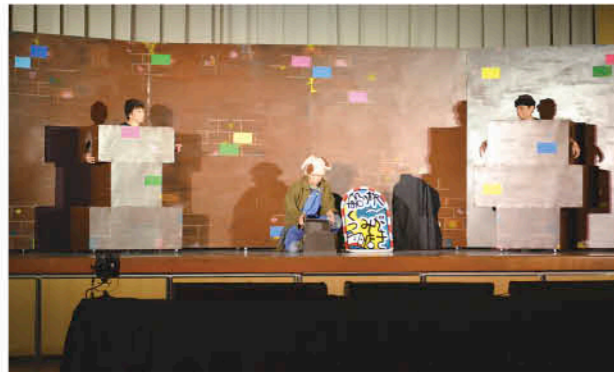
目の前で繰り広げられる劇に大興奮