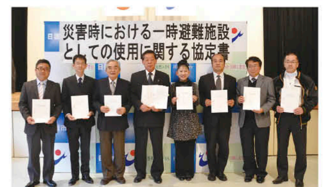
福祉施設関係者と宮路高光市長

11月20日、日置市と福祉施設等の災害時における一時避難施設としての使用に関する協定書調印式が、市中央公民館で行われました。この協定は、市内の福祉施設など11カ所と協定を締結し、災害発生時に施設の利用を可能にするものです。災害時の自主避難の際に市指定の避難所への経路が河川の横断などで困難な場合には、福祉施設などの一部を借用できます。これまでも突然の災害に対処するためさまざまな協定を締結してきましたが、今回の協定で、さらなる安全確保への効果が期待されます。