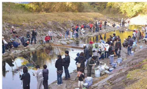
大盛況のマス釣り大会