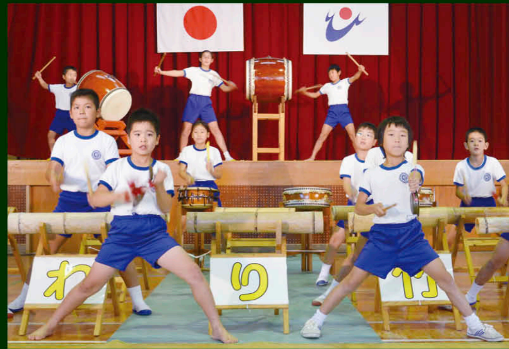
地区文化祭で披露されたひまわり竹太鼓

今年で創立133年を迎える和田小学校(吹上)。「ひまわり」の花のように、明るく元気で前向きな子をキャッチアップする。8月は校区夏祭り。11月は日置市音楽発表会と校区文化祭。このように多くの機会が披露し、地域になくてはならない活動になっています。