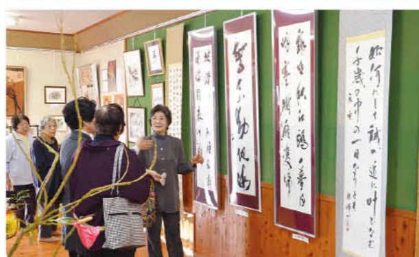
たくさんの作品が展示

11月10日、11日の2日間にかけて、第15回朝日ヶ丘文化祭が、朝日ヶ丘自治公民館で行われました。