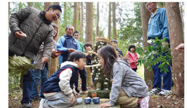
もちをくっつけた田の神像の前でもちひっばれ