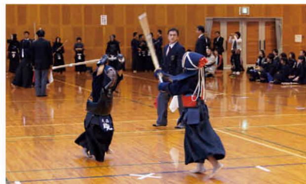
勝敗が決まる一瞬