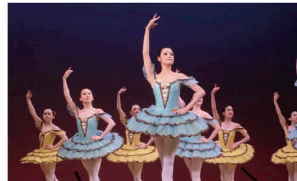
さまざまな催し物を披露