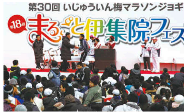
豪華景品が当たった抽選会

梅マラソンジョギング大会にあわせて、12月8日から9日にかけて、まるごと伊集院フェスティバルが開催されました。