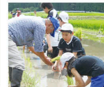
地域の方と田植え

また、読書活動にも力を入れており、23年には文部科学大臣表彰を受けました。図書室は、校舎の中心に位置し、オープンスペースになっているのでいつでも気軽に立ち寄れる場所になっています。各教室にも図書コーナーを常設し、子どもたちがすぐ手を伸ばせるように本があるようにしています。