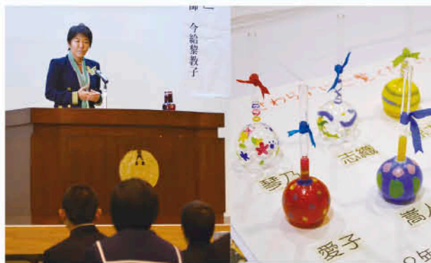
展示作品に講演会と盛りだくさん

11月2日、上市来中学校で文化祭が行われました。文化祭テーマは「TREASURE～一人一人が大切な宝～」。内容は生徒たちのダンスや劇、さらには英語の暗唱大会と盛りだくさん。陶芸や職場体験学習の発表内容の展示なども行われました。