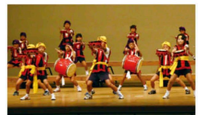
住吉小学校(日吉)のエイサー