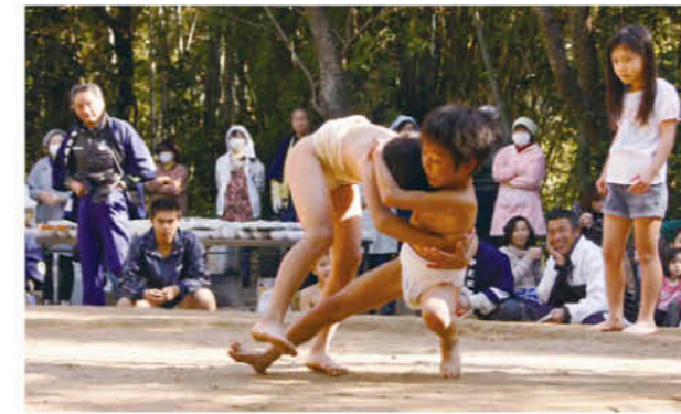
白熱した試合が展開