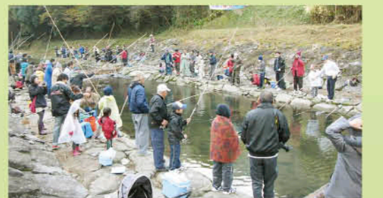
人口倍増のマス釣り会場(郷戸)