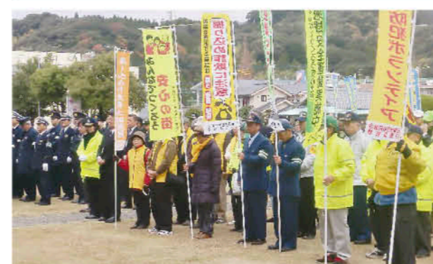
多くの関係者が参列

12月10日、年末年始特別警戒隊出発式が、市役所で行われました。式では、市長・警察署長・日置地区防犯協会会長があいさつをした後、日置警察署警備課による護身術実技指導が行われました。市でも登下校中の生徒に対する声掛け事案や高齢者を狙った振り込め詐欺が発生しております。「自分たちの地域は自分たちで守る」という自主防犯意識を一人一人が持ち、犯罪のない住みよいまちづくりを目指していきましょう。