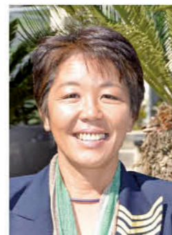
◎海洋冒険家 今給黎 教子さん(47)

いまきいれ・きょうこ 昭和40年、吹上町で生まれる。中学生時代に冒険航海に憧れ、ヨット部がある錦江湾高校に入学。高校総体3位など優秀な成績を残す。1988年に女性初となる太平洋単独往復、1992年に日本人初の東回り単独無寄港世界一周など数々の偉業を成し遂げる。