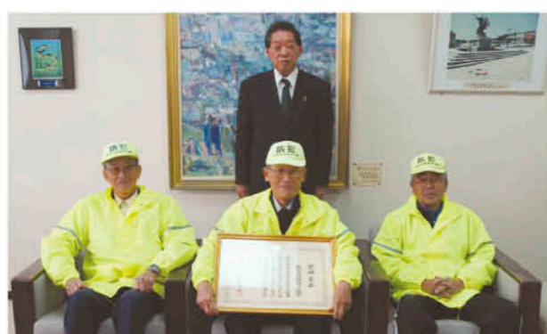
地域の安心安全のために

11月27日、文部科学大臣奨励賞を受賞した妙円寺団地守り隊の方々が、市長を訪問しました。妙円寺団地守り隊は、同団地を住みやすく明るくしたいとの思いで平成16年に結成され、現在隊員は130人余り。「できる時にできる人ができる場所を」というスローガンのもと、随時自主防犯パトロールなどを各隊員が行っています。各学期の始業式や終業式の際には、青色パトカー一班が機動力を生かして団地内の巡回もしており、子どもたちの見守り活動が評価され今回の受賞となりました。