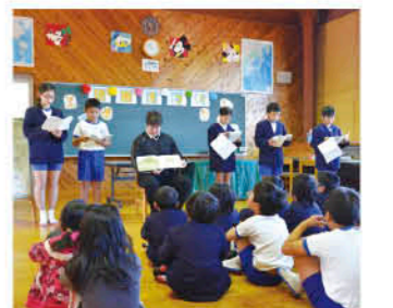
各学級が発表する読書まつり