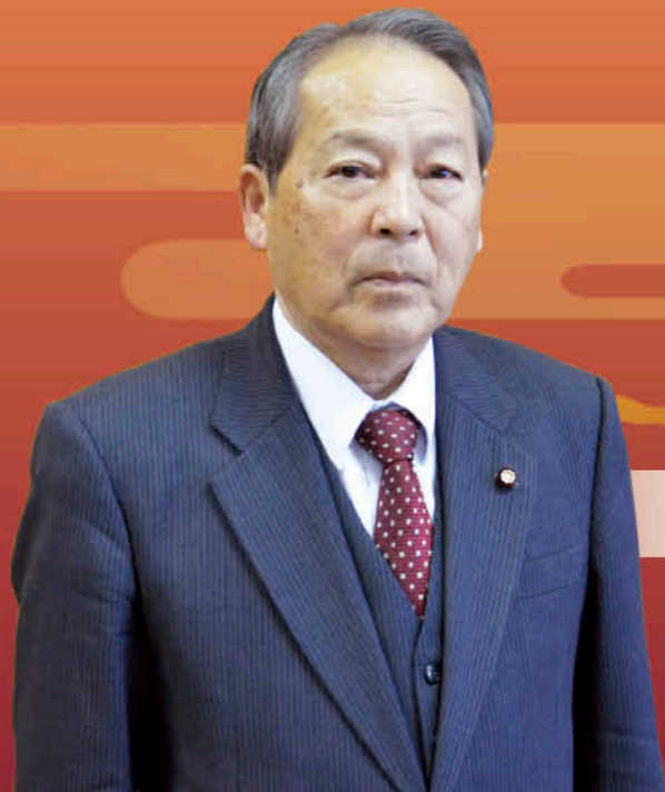
日置市議会議長 松尾 公裕