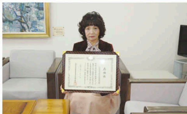
更生保護の推進を

10月4日から5日、第48回九州更生保護女性大会が開催され、日置市吹上町更生保護女性会が、九州地方更生保護委員長から表彰を受けました。近年、地域社会の連帯感や責任感が希薄化し、その保護的機能や教育的機能が低下し、地域社会の環境が大きく変わってきています。青少年犯罪の増加など懸念が広がるなか、同会は、地域に根ざした更生保護の推進を図り、犯罪、非行のない安全・安心な地域づくり、明るい社会の建設に努め、活動を続けてきた実績が評価され、今回の表彰となりました。