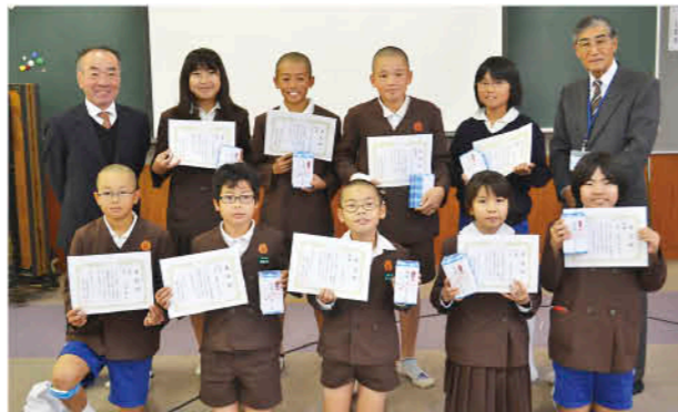
表彰を受けた鶴丸小学校の子どもたち

鶴丸地区公民館が、鶴丸小児童（4年生以上）に健康づくり（特定健診受診率向上）に関する標語募集を行いました。