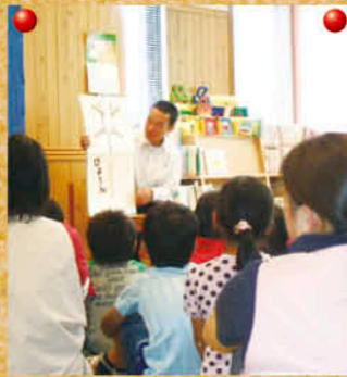
「吹上高校図書委員会」のおはなし会