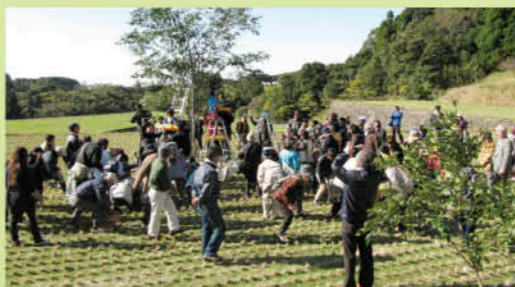
委員も豊作祝いに参加(尾木場)

会場の傍らでは、地域の女性が湯茶で接待。代々伝わるという漬物に「これは売れそう」と、話し込む姿もありました。