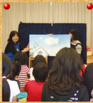
「ほけっとファンタジー」のおはなし会

歌、パネルシアターなどをします。なかでも鹿児島弁で語る影絵は絶品。夜の図書館で行う「星空おはなし会」は、たくさん家族連れが楽しみにしているイベントです。他にも、小学校への出張読み聞かせを行っています。