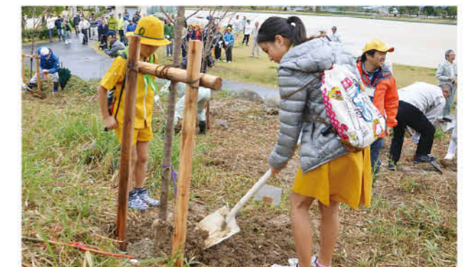
大きくなれと願いを込めて記念植樹