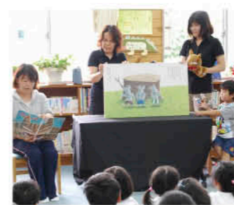
大好評のおひさま読書会

生がスイカの収穫を行い、全児童へ配布。子どもたちもうれしそうに家に持ち帰っていました。他にも、読書活動に力を入れています。子どもたちは図書室が好きで、1学期で一人平均60冊ほど本を読んでいます。また、保護者の方たちも「おひさま読書会」を開き、1学期に1回お昼休みを利用して読み聞かせをしています。子どもたちが本に親しむ良いきっかけになっています。これからも地域の方々をはじめ、学校応援団と協力しながら地域を生かした教育活動に力を入れていきたいと思っています。