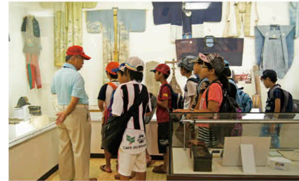
歴史資料の説明を受ける大垣市の子どもたち

岐阜県大垣市青少年交流団一行(10人)が、8月2日から6日まで4泊5日の日程で来訪しました。