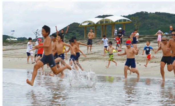
合図とともに一斉に海へ

7月21日から江口浜海浜公園の海水浴場がオープンしました。同海浜公園の海水浴場は、例年県内外からオープンを待ちわびた大勢の海水浴客が詰めかけ、大変なにぎわいをみせました。