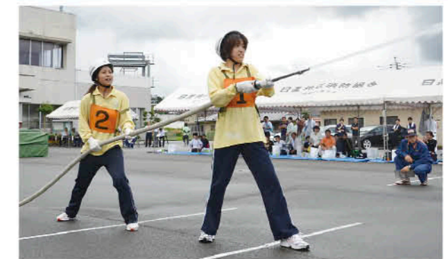
練習の成果を発揮

7月20日、第25回日置市屋内消火栓競技大会が、市消防本部で行われました。毎年市内事業所を対象に行われ、今年は14チームが参加しました。