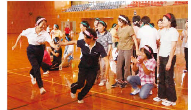
地域の絆をバトンに乗せて