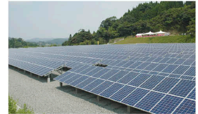
大地に広がるソーラーパネル

伊集院地域(大田上自治会)に建設していた大規模太陽光発電所が完成し、7月30日に同発電所で送電開始記念式典がありました。