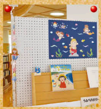
職員も壁紙や手縫いのつるし飾りなどを制作

☆たいふうの会 館内の壁面飾りは、「たいふうの会」というボランティアさんたちが作ってくれています。図書館が開館した時からお手伝いしてもらっています。児童コーナーとはなしのへやの壁面に設営をしてくれます。季節に合ったものや子どもたちに親しまれているおはなしを題材に製作して展示してくれます。