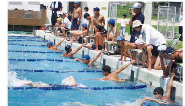
練習の成果を発揮