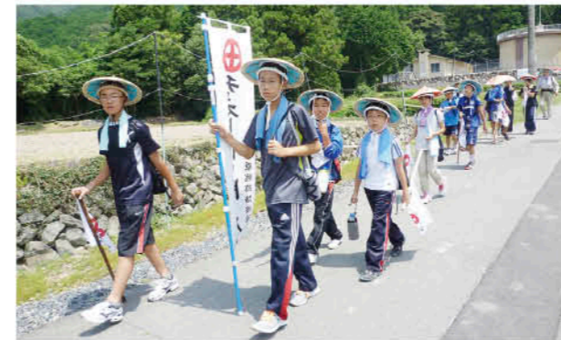
先人の足跡を辿る旅

薩摩義士の足跡をたどる関ヶ原戦跡踏破隊が、8月1日から4泊5日の日程で、岐阜県関ヶ原町や三重県津市などの史跡を巡りました。