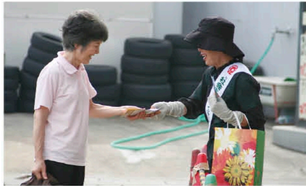
街頭キャンペーンで広報活動