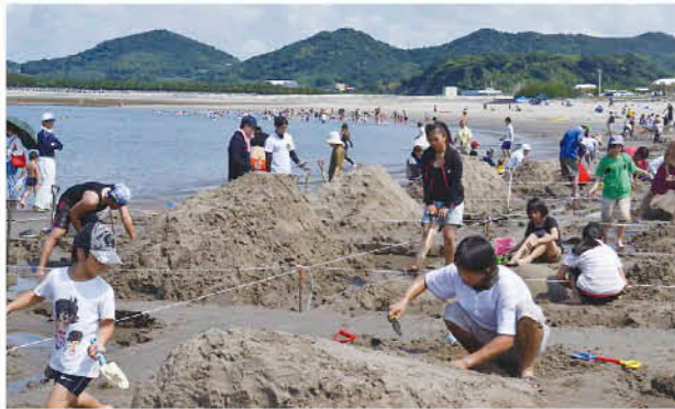
夏空のもと砂像作成

国際サンドアートフェスティバル2012が、7月29日、江口浜海浜公園で開催され、市内外から22チームが参加しました。