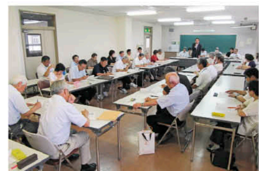
活動の成果や課題が出された意見交換会 (7/3吹上地域)