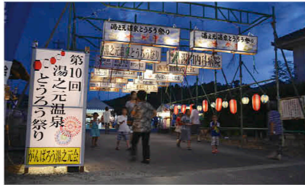
たくさんの灯籠がお出迎え

8月4日、がんばろう湯之元会主催による「湯之元温泉とうろう祭り」が、8月5日には同広場で東市来町飲食店組合主催による「夏祭り」が日置市商工会東市来支所前広場で開催されました。