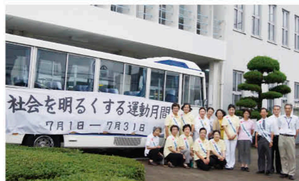
市内各地域で運動を展開

7月4日、「第62回社会を明るくする運動」強化月間が始まったのを受け、日置市保護司会の会員ら5人が市役所を訪れ、市長に法務大臣のメッセージを伝達しました。