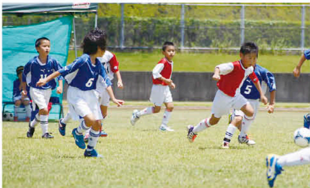
元気はつらつなプレーを披露

7月28日から29日の二日間、吹上かめの子サッカー県大会が、吹上浜公園陸上競技場ほか吹上地域7カ所で行われました。