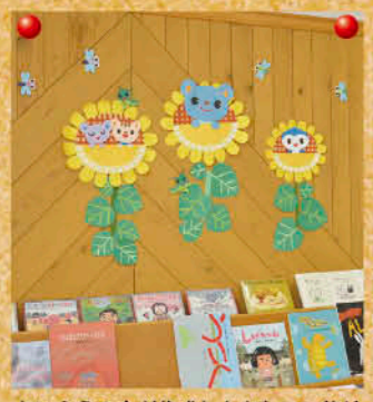
たいふうの会が作成したかわいい飾り

2012年5月号で、ふきあげ図書館施設について説明しましたが、皆さん読んでいただけましたでしょうか。今回は館内の設営等について紹介します。皆さんは図書館の中をじっくりと見たことがありますか？季節にあった壁面飾りがあつたり、館内のいたるところに手作りのつるし飾りがあつたり。図書館の中を目で見て楽しいものにしていきます。これは、ボランティアさんと図書館の職員が毎回テーマを決めて作成しています。