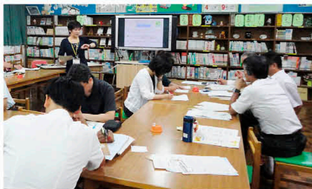
グループワークで勉強

7月9日、住吉小学校で先生たちを対象にハラスメント研修が行われました。日置市男女共同参画相談員が「ハラスメントはいじめのこと」などの説明を行い、自分と他者の価値観を体験するグループワークを行いました。先生方からは『女性からの暴力もDVか』などの質問が出され、相談員は『暴力には男性も女性もない』と答えました。