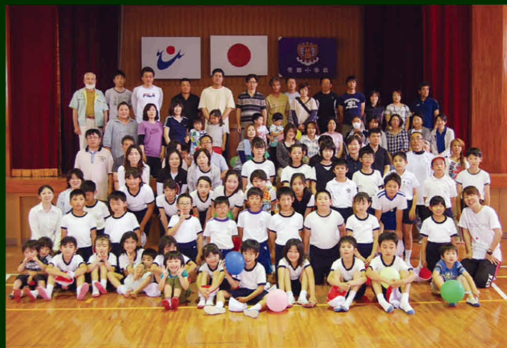
たくさんの保護者が参加した日曜参観

「花いっぱい」読書いっぱい 汗いっぱい」のキャッチフレーズのもと、児童37人が学んでいる花田小学校(吹上地域)。今年で創立133年を迎えます。学校応援団に加入している方が市内で一番多く、地域とも密接につながっています。また学習のしつこくもよく、授業中も熱心に先生と一生懸命取り組んでいます。