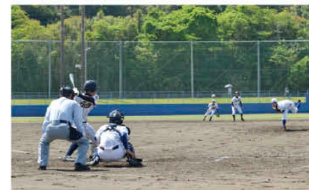
城西高校 VS 福工大城東

4月28日、伊集院球場と東市来湯之元球場で第1回高校招待野球が行われました。県内外から9チームが集まり、地元からは伊集院高校、吹上高校、城西高校が参加。招待野球ならではの強豪と、熱い戦いを繰り広げました。伊集院球場では、ウグイス嬢を城西高校野球部のマネージャーの中野さん、中川さん、川野さんが務め、試合に花を添えました。