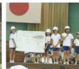
クイズで楽しく学習