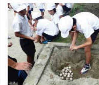
学校内でふ化活動

を作り、学校周辺を周回し多くの保護者、地域の方々の参観者にも自然環境保護の啓発を行っています。また、吹上音頭を全員で踊ったりと、郷土愛を深める活動もあわせて行っています。 「かめさん祭り」では他にも、4年生が学習の中で調べてきたウミガメクイズを全校児童に出題。楽しみながらウミガメや吹上浜の自然について学んでいます。