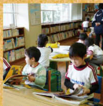
館内の子どもたち

面積は、600㎡とあまり大きくありませんが、近くに小学校や幼稚園があることから、子どもたちが、たくさん利用してくれています。