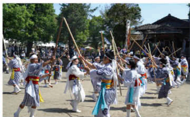
豊作と悪疫退散を祈願