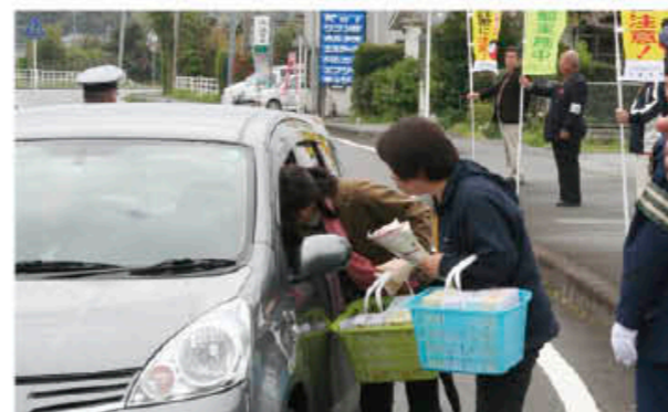
通行車にチラシとティッシュを配布

5月13日、日吉地域民生委員・児童委員連絡協議会が、おれおれ詐欺など「振り込め詐欺」の被害防止をPRするため、街頭キャンペーンを行いました。