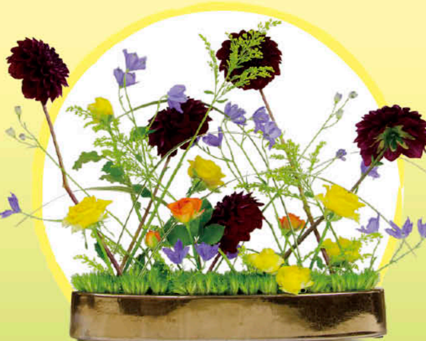
アレンジメント：花のなかま

今回の特集記事をきっかけに皆さまがソリダゴのことを、日置市のことをもっと少し知るお手伝いができたのなら幸いです。さりげなくアレンジメントの中に隠れているソリダゴ。そしてそのアレンジメントになくはない「ひおきの特産花」。皆さまが、普段家の中で見慣れているアレンジメントの隅っこで、ひっそりと咲いているかもしれない。と、「私に振り向いて」と。