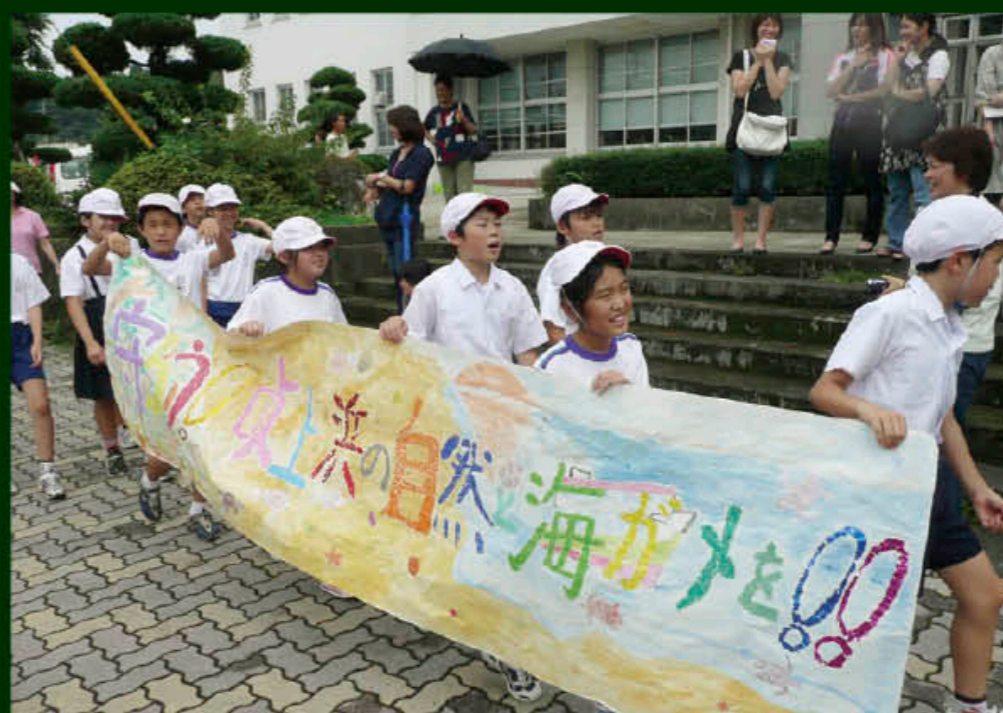
「かめさん祭り」での全学年街頭パレード

たくさんの子どもの声があふれる伊作小学校。創立143年目を迎え、今年40人の1年生が仲間入り。現在255人の児童が学んでいます。 「花いっぱい、汗いっぱい、笑顔いっぱい」の伊作小」をキャッチフレーズに、人間性豊かで、自主性・創造性に富み新しい時代に明るくたくましく生きる伊作っ子を目指して日々さまざまな活動を行っています。