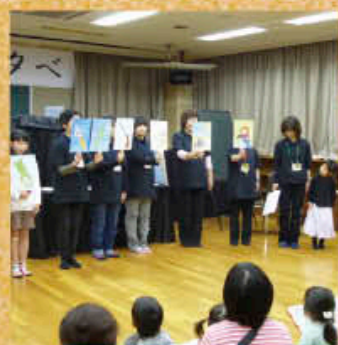
4月に行われた読書の夕べ

学校や子ども会、育児サークルなどへ、本の団体貸出や読み聞かせの出前を行なうなど、連携を密にして、子どもの読書活動推進に努めています。