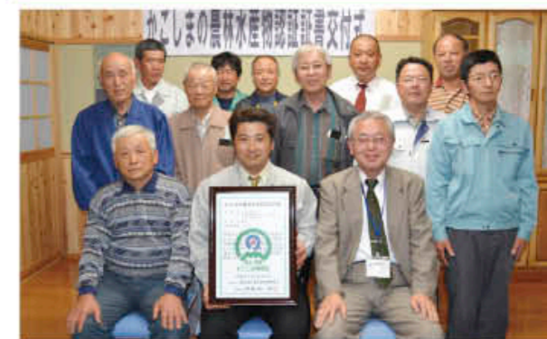
市の緑茶では初めての快挙

日置市茶業振興会の会員とその系列農家8人が、緑茶の「かごしまの農林水産物認証」を取得し、4月17日に認証交付式が備前製茶で開催されました。