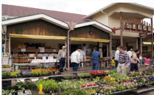
きれいな花がたくさん