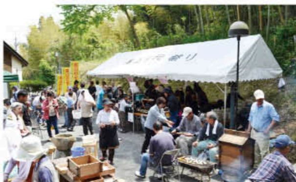
多くの来場者で大にぎわい

4月29日、美山地区の四百年窯広場で美山ウォーク・窯焚きコンサートが行われました。