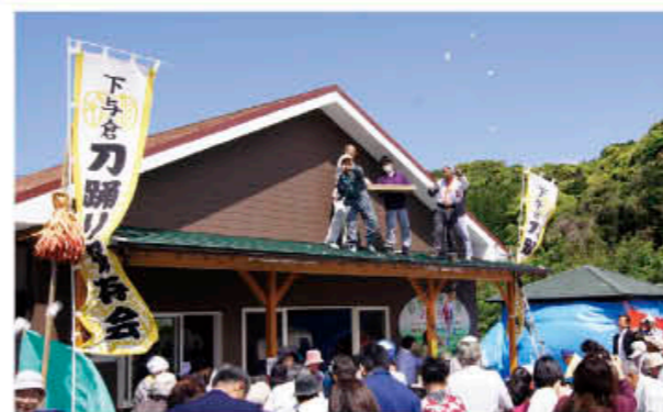
落成祝いの餅投げ

5月3日、貸し農園「やすらぎの里」広場（吹上）で「さくら館」落成記念式典と、第4回きらめく農村・農業祭が行われました。