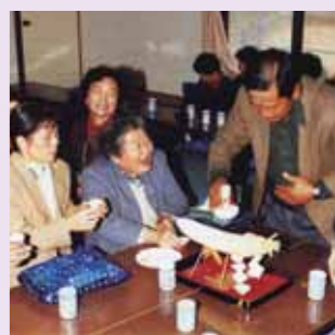
▲地域伝統の「お伊勢講」

今 田に伝わる伝統行事には盆相撲や棒踊りなどもあります。棒踊りは踊り手不足で昭和六十年を最後に披露されなくなりましたが、踊りを復活させようという取り組みも行われています。「人口が増えつつある地域、社会の変化に合わせる運営はなかなか大変ですが、地域の伝統と人材を大切に、次代に伝える活動を行っています」