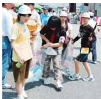
▲ごみ拾いをする伊作田小6年生

五月三日、江口漁港(東市来)で「第十五回ふるさと港祭り」が開催されました。花火を合図に漁船がさつそうと入港し、祭りがスタート。漁船からの餅まきが一気に祭りを盛り上げます。