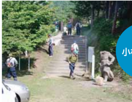
たてわき 小松帯刀会

これは、平成二十年にNHKで放映される大河ドラマ「天璋院篤姫」で薩摩藩家老・小松帯刀公が取り上げられるのを機に、同公が眠る園林寺跡をきれいにしようといわれたものです。きれいに清掃された園林寺跡。この機会にぜひ訪れてみては。