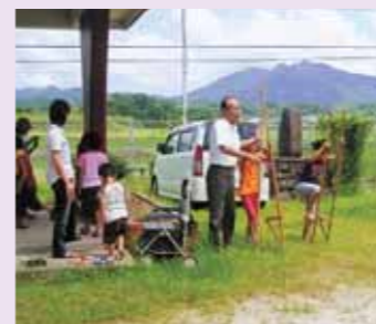
▲子供会育成会との交流

交 通の利便がよく、自然に恵まれた今田自治会。地域外からの転入者も増え、自治会活動も活気にあふれています。自治会には青壮年部、女性部、長寿会、子供会育成会を組織。住民の親睦と融和を図りながら、円滑な運営ができるよう力を合わせています。