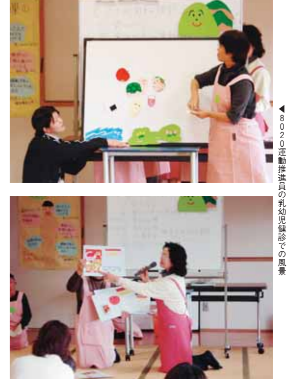
8020運動推進員の乳幼児健診での風景