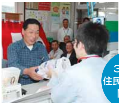
▲郵便局窓口で証明書を受理する住民

また、市では市内二十一地区公民館で五日から証明書発行業務をスタート。郵便局では月々金曜日の午前九時から午後四時、