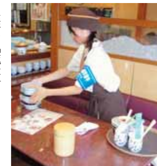
▲「腕章」をつけて働く生徒

実行委員会では今年度から、職場体験学習実施中の「のぼり」と「腕章」を作成。「のぼり」を職場体験受入事業所に設置し、