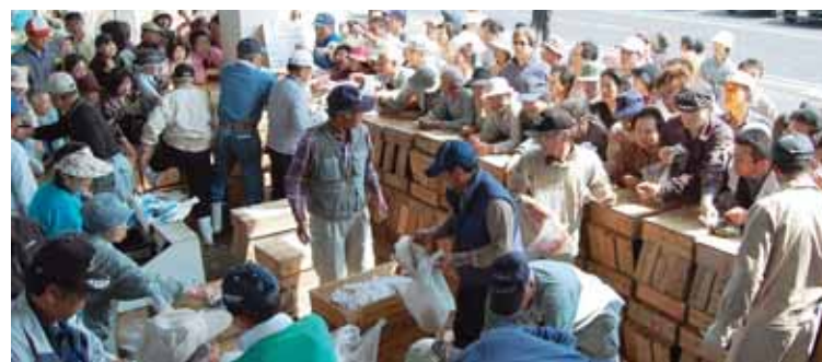
▲多くの人でにぎわう鮮魚販売コーナー

草原自治会、八幡自治会が御神田付近の清掃作業を行いました。河川流域の雑草などを取り払い、すっきりとなった大川八幡橋周辺。このようなボランティアもあり、せつとべ当日は大盛況のうちに幕を閉じました。