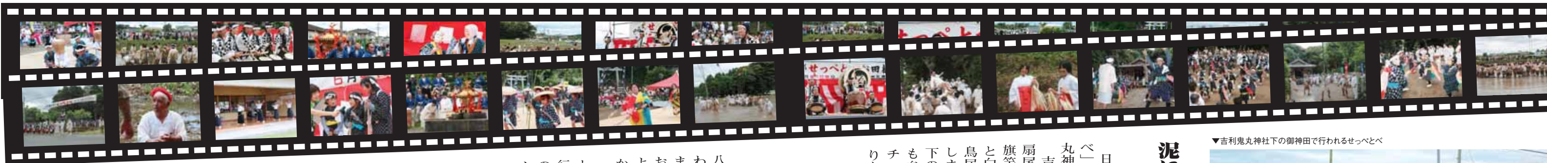
▼吉利鬼丸神社下の御神田で行われるせつとべ