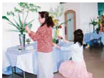
▲生け花で彩られるレストラン入り口