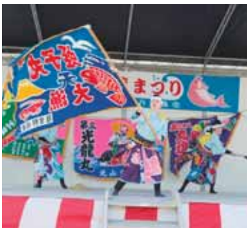
▲舞踊を披露(イベントステージ)