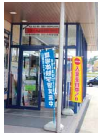
▲受入事業所に設置された「のぼり」

職場体験学習は、生徒が実際に事業所などで働くことを通じて、働くことの喜びや厳しさ、職業観や勤労観を学ぶ貴重な社会学習。