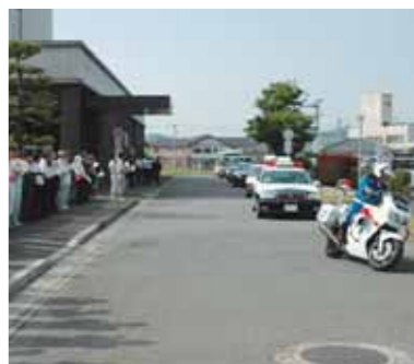
▲市内パレードへと出発

運動初日の五月十一日には、交通安全を訴える市内パレードのあと、終点のひまわり館前で街頭キャンペーンが行われました。