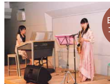
日本の四季コンサート

「これは絵ですか」と来場者が尋ねるほど繊細かつ色彩豊かな写真九十点が教室や廊下を飾り、「木目と写真が一体となって作品が生きています」と好評。期間中、主催者の予想を大きく上回る約九百人が野首を訪れました。