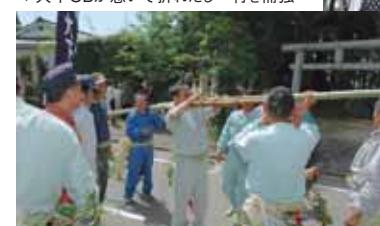
▼大下OBが急いで折れたしべ竹を補強