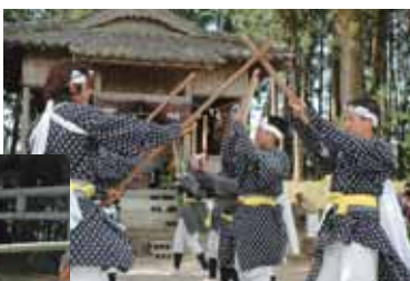
▲飯牟礼中の棒踊り

あるしべ竹を持ち寄り、そのしべ竹を神社の鳥居にくぐらせ、境内横に立て掛けてから踊りを奉納します。ところが、今年は大下のしべ竹が鳥居をくぐる前に折れてしまうというハプニングが起き、大下のOBが急いで棒と縄で補強する姿も見られましたが、無事境内へと運ばれ踊りを奉納することができました。 五穀豊稔と家内招福を祈願する伝統の飯牟礼棒踊り。今年も地区にとって実りある年になることでしょう。