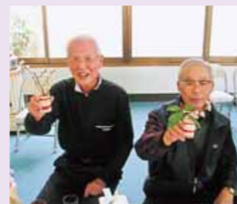
▲爪楊枝で手桶づくり

地 域の活発な活動のひとつ、「今田いきいきサロン」。「市元気な市民づくり運動推進計画」を受け、地域住民の健康づくりや高齢者のいきいきづくりを目的に平成十七年六月に設立。女性部が中心となって運営するこのサロンは、二カ月に一度、地域の高齢者が集う交流の場となっています。昨年七月は、子供会育成会との交流会を開催。子どもたちに昔の遊びを体験させようと、竹馬、竹とんぼ、お手玉を一緒に作りました。大人が教え、子どもが学ぶ。いつしか大人も子どもも夢中になって遊ぶようになりました。また、一月の食事