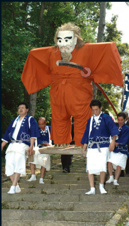
おどん 大王殿のお通りだ～!

境内や御神田で飛び跳ねて泥んこになる「せつとべ」田植えがしやすいように土をこね、害虫を踏みつぶす。今年の大豊作を願い、精一杯の元気で飛び跳ねる。