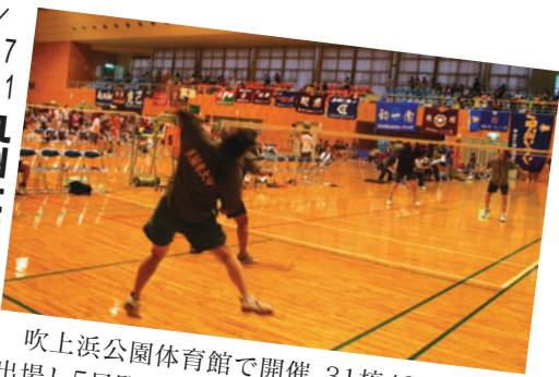
吹上浜公園体育館で開催。31校49チームが出場し5日間の熱戦を繰り広げました。