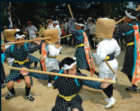
虚無僧踊り (八幡集落)