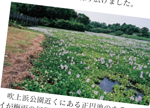
吹上浜公園近くにある正円池のホテイアオイが梅雨の幻想的な風景を見せました。