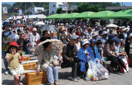
▲ 大勢の人出でにぎわいました