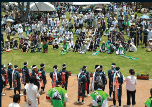
盛り上がるイベント会場

見物客から喚声が上がっています。竿をすべて運び終わると、いよせつべとべが始まります。せつべとべ衆は景気つけの焼酎を飲みながら、歌に合わせて肩を組み、威勢よく飛び跳ね、豊作を祈願しました。 晴天に恵まれたこともあり、地域内外から多くの見物客が訪れ、泥だらけで精一杯飛び跳ねるせつ