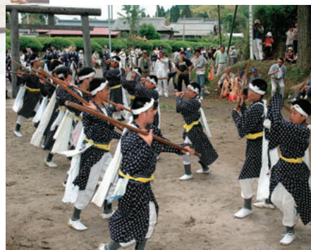
写真 上 上土橋棒踊り 右 飯牟礼棒踊り

飯牟礼上は虚無僧踊りと各集落に伝わるそれぞれの踊りがあり、踊り手は伝統を受け継ぎ、勇壮な舞を披露しました。また、上土橋の棒踊りも四月二十四日に、地区内の勝護院に奉納されました。小学四年生から中学三年生までの十五人が、勇ましい踊りを奉納。同時に行われた運動会でも披露し、大勢の観客から拍手を浴びていました。