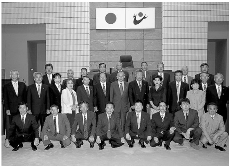
6/9の臨時議会でスタートした日置市議会