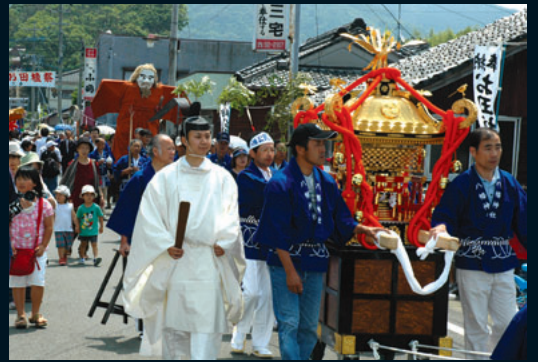
踊りはいっそうにぎやかに

見物客から喚声が上がっています。竿をすべて運び終わると、いよせつべとべが始まります。せつべとべ衆は景気つけの焼酎を飲みながら、歌に合わせて肩を組み、威勢よく飛び跳ね、豊作を祈願しました。 晴天に恵まれたこともあり、地域内外から多くの見物客が訪れ、泥だらけで精一杯飛び跳ねるせつ