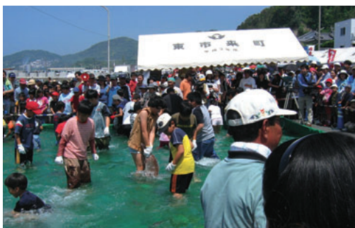
▲ 人気の魚のつかみ取り大会