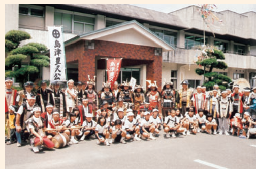
天昌寺祭りの武者行列(後ろは地区公民館)

ほかにも、伝統的な夏祭り「六月灯」や夜に開催される「永吉川筏くだり」など、地区民が一体となって実施する行事は数多く、子どもから高齢者までふれあいの場が生まれ、そこからまた地域づくりの話が広がっていきます。