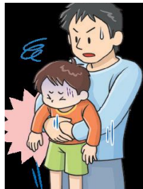
腹部突き上げ法→ (ハイムリック法)