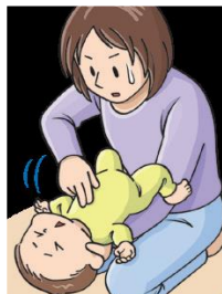
胸部突き上げ法 (ハイムリック法)