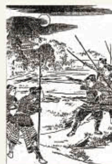
国立国会図書館蔵「西郷隆盛評伝 絵入通俗」一冊 挿絵より

【参考文献・史料】：村井寛氏「西郷隆盛評伝 絵入通俗」一冊(岩波書店1989)、「大久保利通日記」下巻(マツノ書店2007)、「西郷隆盛」(角川書店2009)、「西郷隆盛」(角川書店2009)、「西郷隆盛の謎」(角川書店2007)、同氏監修「幕末明治 鹿児島県誌 解き散す」(同社同年)