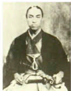
▲小松帯刀像(尚古集成館蔵)

日時: 11月25日(日) 午後3時~午後4時30分 会場: 日置市伊集院文化会館ホール 定員: 1000名(予約不要・当日先着) 入場料: 無料 内容: