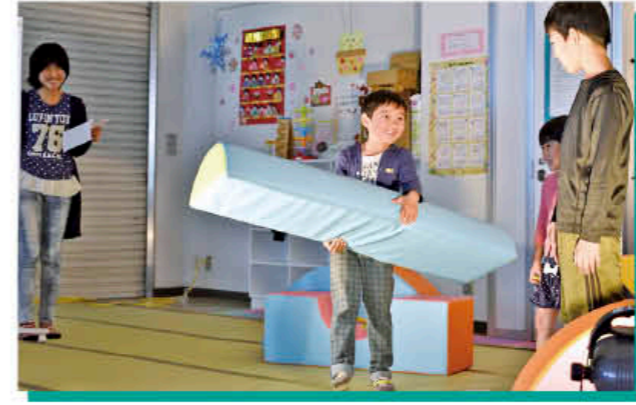
▲熱い演劇が繰り広げられました