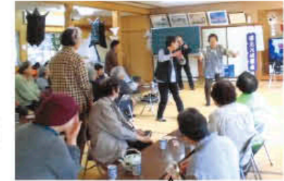
誕生会では 踊りも舞われます