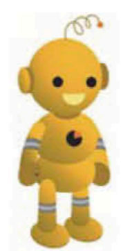
工業統計キャラクター コウちゃん