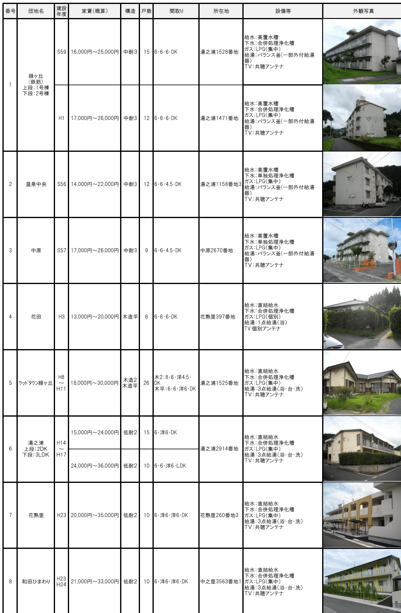
日置市公営住宅一覧表(吹上地域)