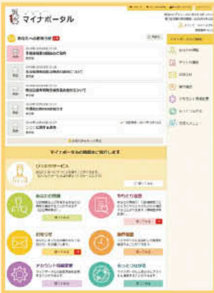
↑マイナポータル画面

マイナポータルは、マイナンバー制度が導入に合わせ構築された、政府が運営するオンラインサービスです。 マイナポータルは、行政が持っている情報（地方税情報等）を自分で確認したり、自分の個人情報を行政機関同士がどのようにやりとりを行っているのか等を確認したりすることができ、主な機能は次のとおりです。 【主な機能】 ■あなたの情報：行政機関などが保有するあなたの個人情報を検索して確認することができます。 ■やりとり履歴：行政機関同士があなたの個人情報をやりとりした履歴を確認できます。 ■操作履歴：マイナポータルの操作履歴を確認することができます。 ■びったりサービス：あなたにあったサービスの検索ができた、行政機関や民間事業者へオンライン申請を行ったりすることができ、（詳細は子育てワンストップサービス参照） 【利用方法】 自宅でマイナポータルを利用するためには、電子証明書を搭載したマイナンバーカード・パソコン・マイナンバーカードに対応しているICカードリーダーが必要で、 本市においては、各地区公民館にマイナポータルを利用できる環境を準備していますので、ご活用ください。