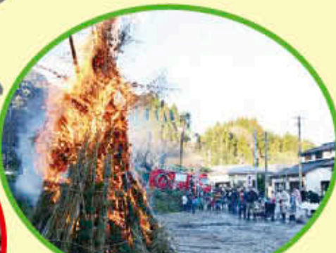
次代につなぐ伝統行事や地域文化