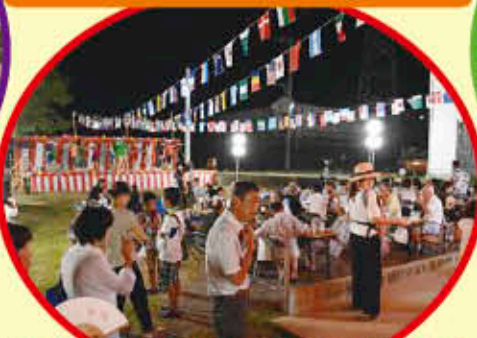
祭りで地域住民と親睦と交流