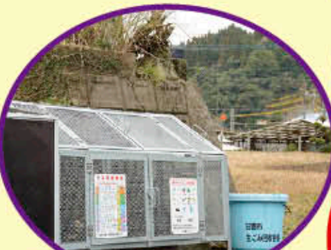
ゴミステーション・防犯灯は自治会で維持管理