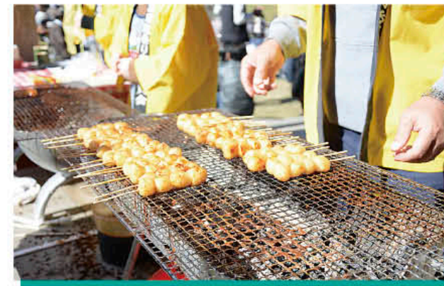
▲会場にはしんこ団子の香ばしい匂いが