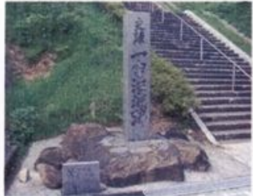
⑥ 一字治城跡 鎌倉時代の初め、紀氏が館を構えたといわれ、その後に伊集院氏が住んだと考えられています。島津家15代当主貴久は、ここを三州守護職島津家第15代太守の本城と定めています。