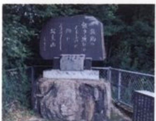
⑦ 平野国臣歌碑 「我胸の燃ゆる思ひに くらふれば 煙はうすし 桜島山」幕末の勤皇の志士平野国臣が詠んだ名歌です。島津久光に倒幕を勧めようと、同志有馬新七の協力を得るため、伊集院に滞在したが倒幕への決起にはならず、国臣が涙をのんで伊集院を去ろうとする時に詠まれました。