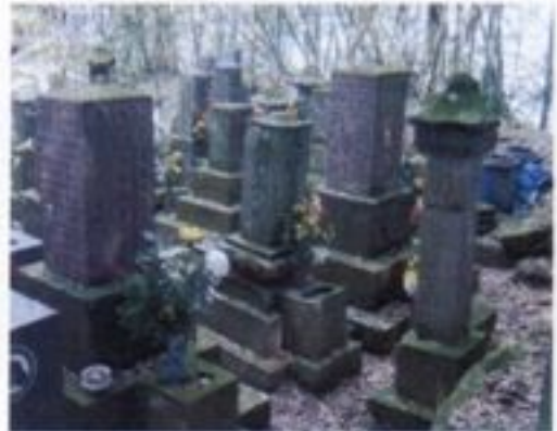
⑤ 本田兄弟墓碑 戊辰の役に若くして散った本田親正・親直兄弟の墓で兄弟の父と親交があり、かつ兄弟を可愛がっていた西郷南洲が明治2(1869)年に建立したものです。碑面には、翁の直筆で招魂文が刻まれています。