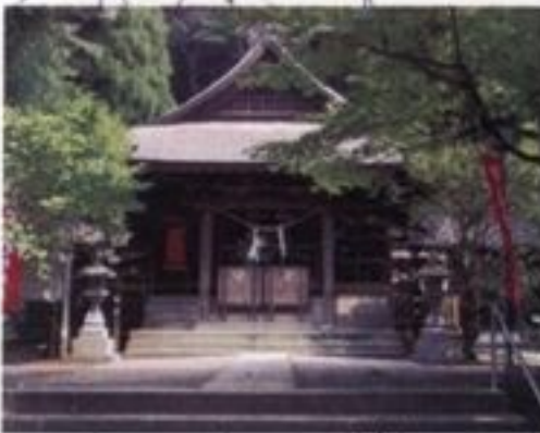
⑩ 徳重神社 祭神は「精矛巖建男命(島津義弘)」で、廃仏毀釈によって菩提寺妙円寺が壊された後、明治4(1871)年に、妙円寺の本堂を神殿として建立されました。御神体は、島津義弘の木造です。