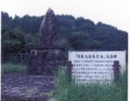
⑧ 有馬新七誕生之地 記念碑 有馬新七は伊集院町小城集落の坂木家に、坂木貞常の三男として文政8(1825)年に生まれ、文政10(1827)年8月、鹿児島城下の御子姓組有馬与之介の跡を相続することになり、鹿児島に移住しています。