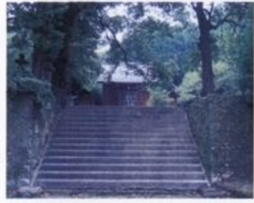
③ 南方神社 一字治城を護るために、宝徳2(1450)年に城の大手門の真向かいに神社が建てられました。伊集院五社の筆頭で足利時代の頃には六十町歩にも及ぶ田畑が日置郡内から寄進されています。