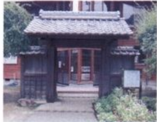
④ 武家屋敷門 この門は旧伊集院地頭仮屋の門で、明治元(1868)年伊集院小学校が、地頭仮屋跡に設立された時、小学校の門として使用された後、一時個人の所有となりましたが、昭和60年6月町へ寄贈されています。