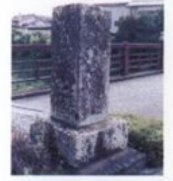
① 永平橋と記念碑 下谷口川に架かるこの橋は、長さ12間の土橋であったが、嘉永3(1850)年11月29日に着工、翌年1月20日に竣工した石造眼鏡橋でした。記念碑の文字は、西郷南洲が筆を振ったと伝えられています。