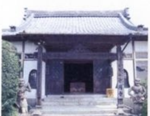
⑨ 妙円寺 興国6(1345)年石屋真梁和尚が開いたものです。妙円寺という名については、今の山口・広島県の守護であった大内義弘の娘の法名「法智妙円大姉」とったものです。