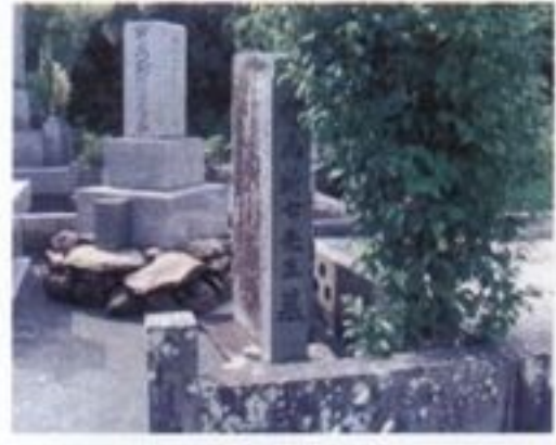
② 有馬新七墓碑 有馬新七は吉田松陰、真木和泉と並ぶ、明治維新の原動力となった志士です。文久2(1862)年4月、寺田屋事件で同じ薩摩藩士らとの斬りあいの末、絶死をとげました。墓は南林寺墓地撤去により、現在地に移されています。