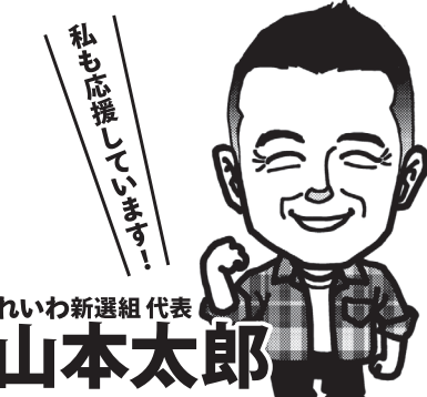
れいわ新選組代表 山本太郎