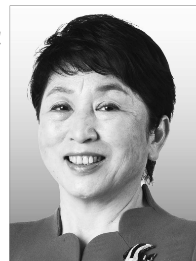
社民党党首 福島みずほ