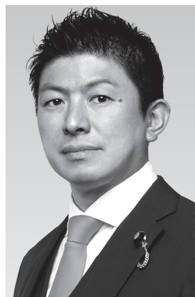
参政党代表・神谷宗幣