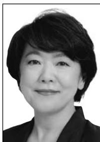
沖縄3区 島尻 あい子