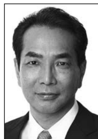
宮崎2区 江藤 拓