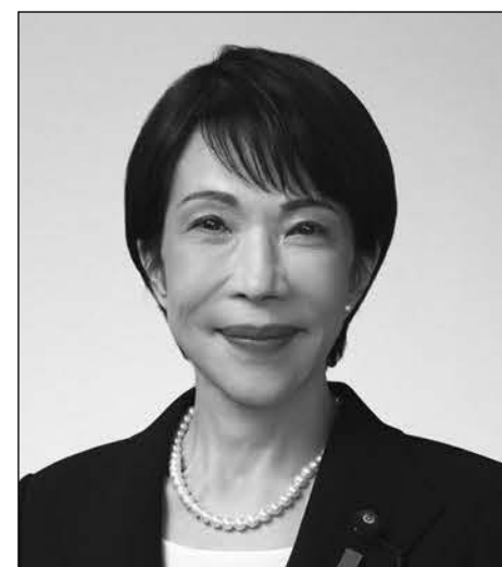
自由民主党総裁 高市 早苗