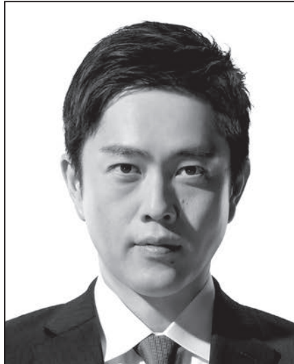
代表 吉村 洋文