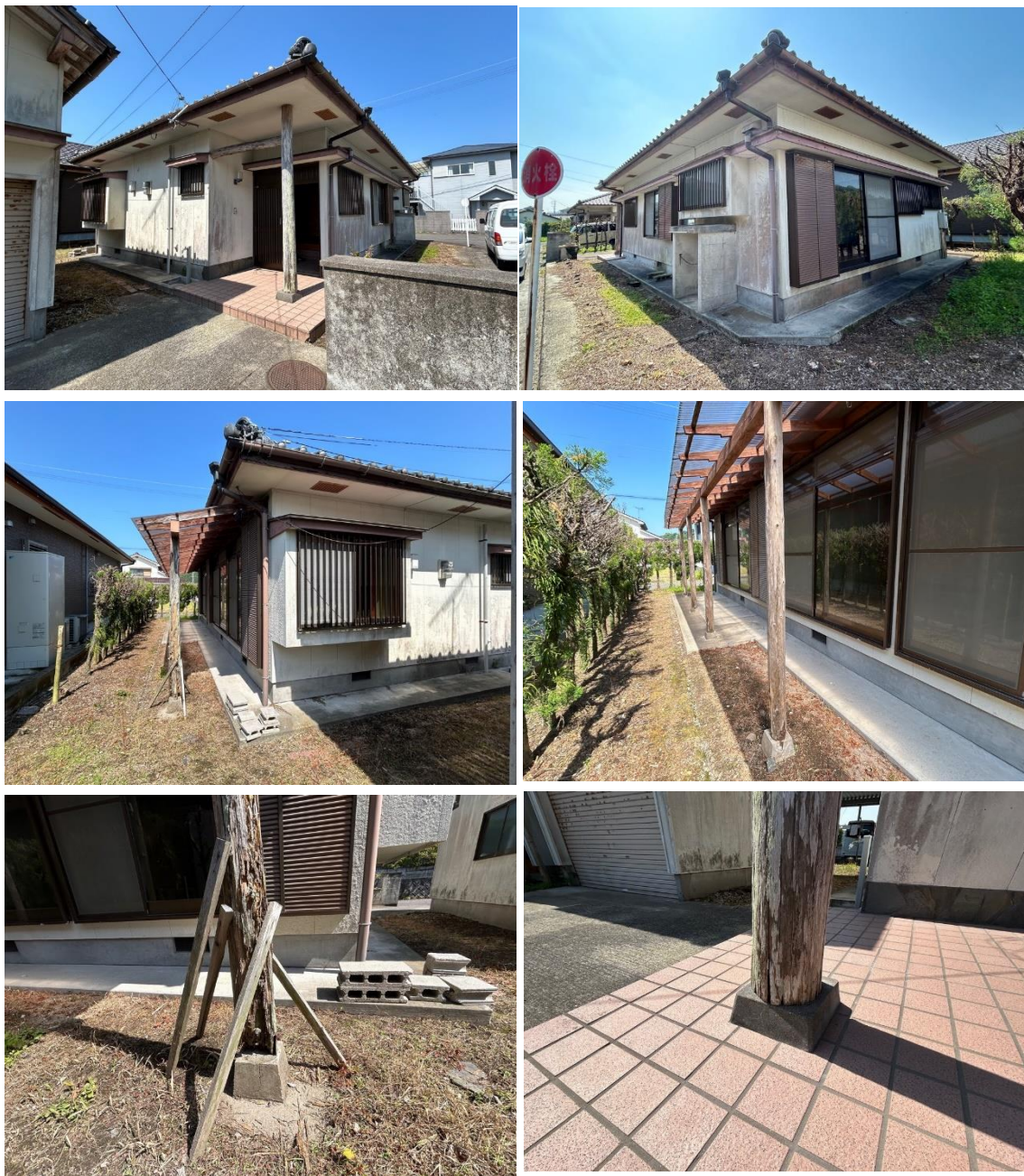
建物外観（榎下一般住宅西 居宅部分）