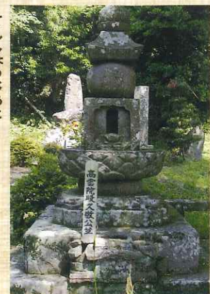
島津久敬の墓(天昌寺跡)

永吉島津家は、十五代島津貴久の四男である家久を祖とするもので、二代には関ヶ原の戦いの際に、島津義弘の身代わりとなった島津豊久がいる。この永吉島津家の菩提寺が天昌寺である。明治初年の廃仏毀釈によって廃寺となり、現在は歴代の当主の墓などが並ぶ墓地のみが残っている。この墓地のなかには、今和泉島津家より養子に入った久敬(篤姫の兄であり、島津忠剛の二男)の墓もある。ただ久敬については、様々な事情が交錯しており、当主でいる期間は、わずか三年と短い。