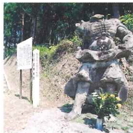
▲園林寺跡入口の仁王像 ▲小松帯刀（手前）と妻 お近の墓