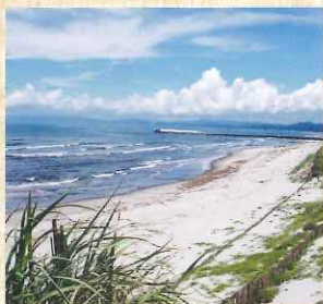
日本三大砂丘 吹上浜