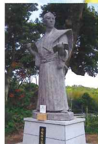
▲清浄寺の小松帯刀像