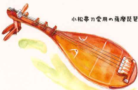
小松帯刀愛用の薩摩琵琶

苗代川（現日置市美山）の沈家に、古式ゆかしい立派な薩摩琵琶がある。沈家の伝承によれば小松帯刀愛用の薩摩琵琶だといふ。小松が亡くなったのは明治三年、そのころ薩摩焼を世界に向けて発信し絶賛を浴びていたのが、十二代の沈寿官である。おそらく小松から沈寿官に渡つたものであろう。