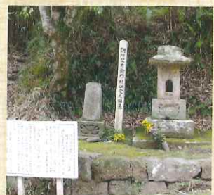
調所笑左衛門広郷・ 村田堂元甫阿弥招魂墓