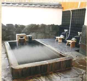
西郷どんの湯・中島温泉旅館 (宿泊者のみ)