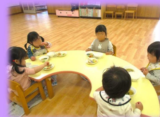
< 行事食 (例:お誕生会) >