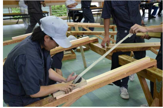
開校記念行事 (かんな削り大会)