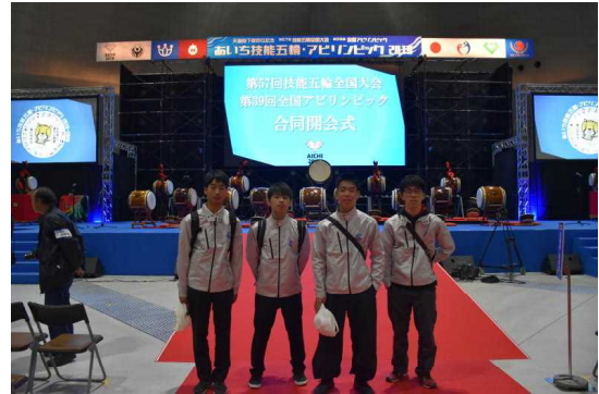
全国技能五輪大会