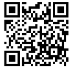
「プラスチックを調べよう」 はこちらから見られます。